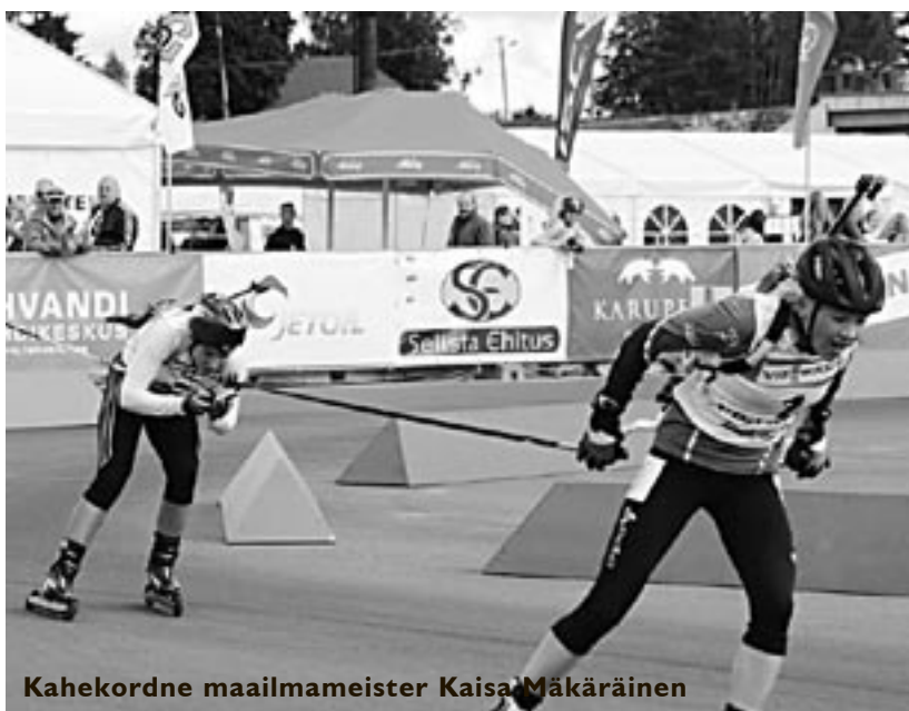
Kahekordne maailmameister Kaisa Mäkäräinen