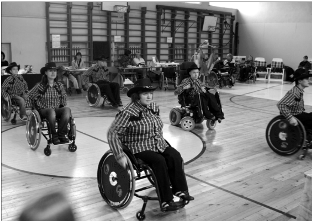
Pärnu ratastooli line-tantsu grupi Silver Wheels esinemine ei jätnud kedagi ükskõikseks.