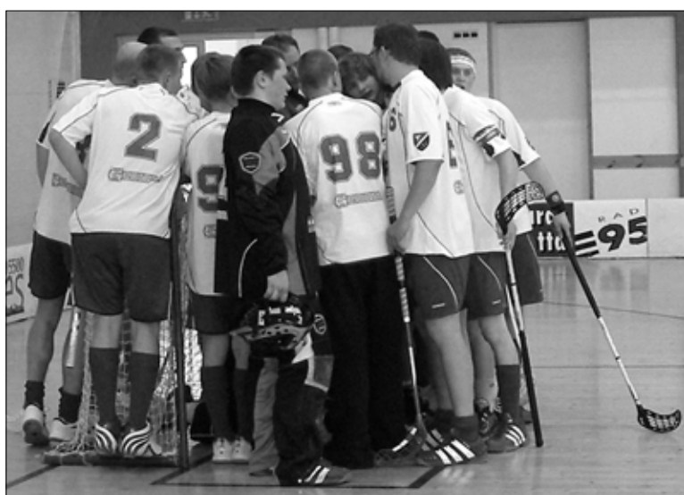
Enne võistlustulle astumist koguneb meeskond kokku ühiseks ergutus-hüudeks.

Laupäev, 27. oktoober 11.00 Tapa Hummel Team - Näpi (TL)