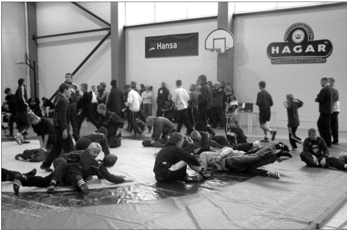
Enne võistlust tegid maadlejad lihased soojaks.