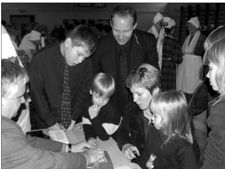
Pimedatele kirjutatud puuteraamatute lugemine tekitas elavat huvi infopäeva külastajate hulgas.