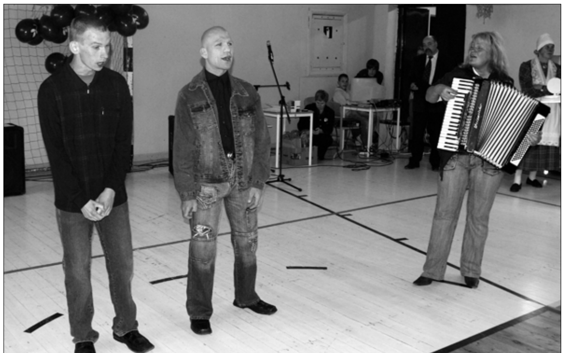
Imastu koolkodu poisid koos muusikaõpetajaga andsid meeleoluka kontserdi populaarsetest lauludest.