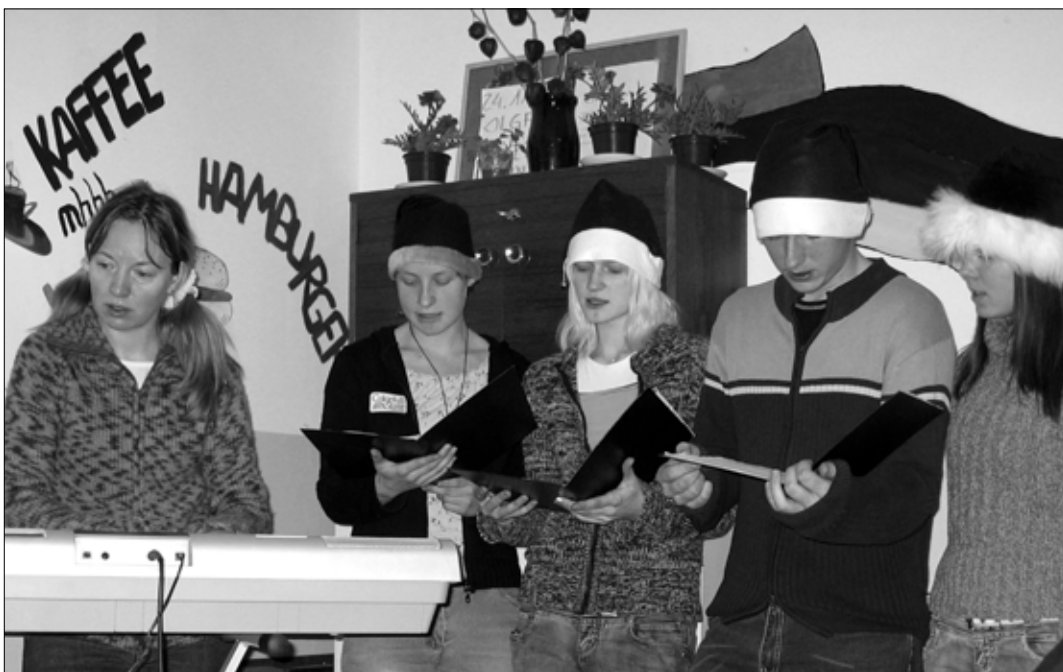
Paari aasta tagune jõulumeenus MTÜ Jeeriko jõulupeost.