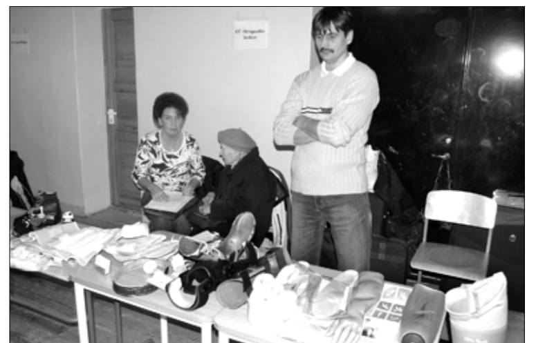
OÜ Ortopeediakeskus oli Tapa invainfopäevale kaasa võtnud mitmesuguseid abivahendite näidiseid.

Patsiendi teenindamise aluseks on perearsti või eriarsti saatekiri ja isikliku abivahendi kaart. Abivahendi valmistamisel arvestame arsti soovitusi, patsiendi tervislikku seisundit, vanust, soolisust, aktiiv-