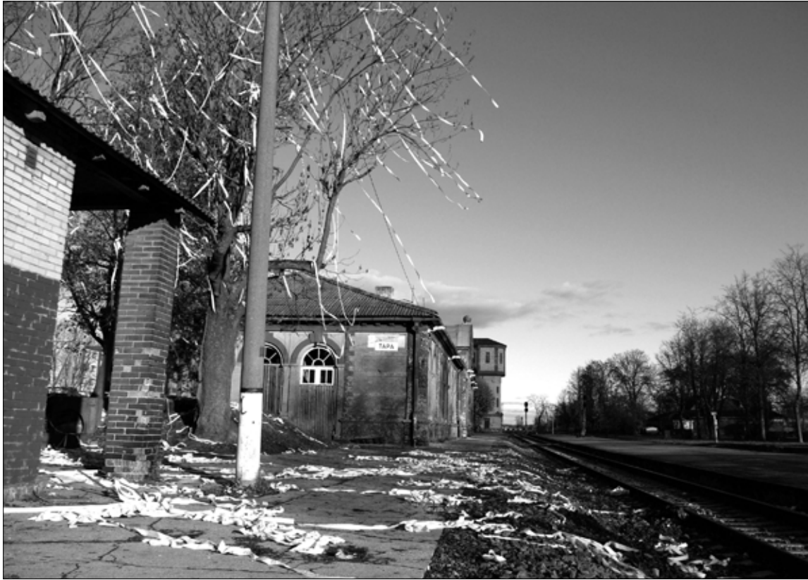
Eelmisel nädalavahetusel "kaunistasid" huligaanid Tapa räämas vaksalihoone kõrval asuvad puud paberibadega. Koristajad polnud suutnud nädala alguses veel rämpsude koristada.