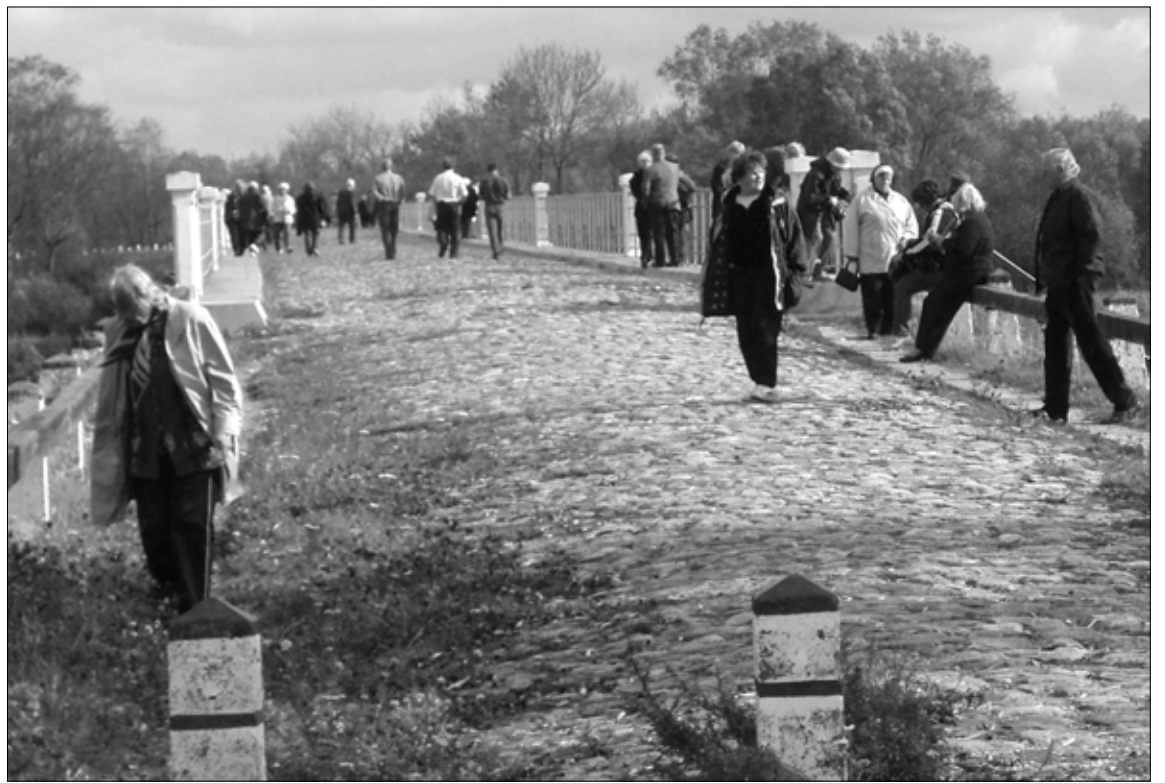
Eakate ekskursioonist osavõtjad tegid peatuse ka Kasari jõe vana silla peal.