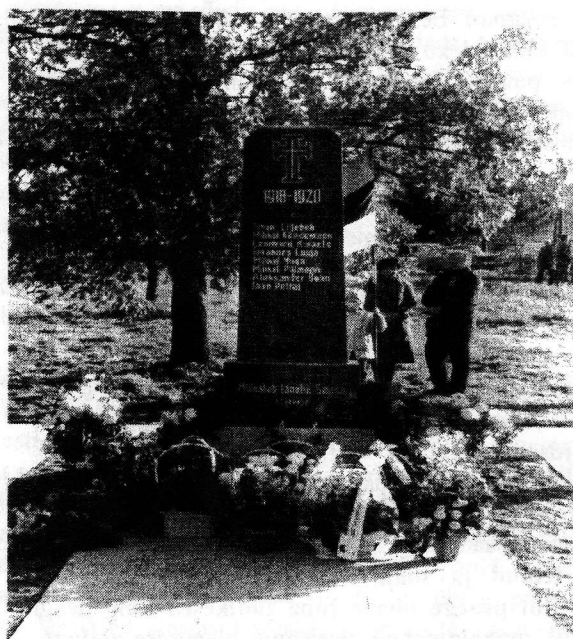
Võrumaa Muinsuskaitse päevad 1989 Taasavatud Vabadussõja ausammast Sännas

Kohus meie üle toimus Roosikrantsi tänaval. Algul viidi meid sinna lahtise veoautoga, aga kui meie tüdrukud võtsid üles isamaalised laulud ja seda kesklinnas, siis hakati meid vedama kinnistes kongides. Meid oli kokku 39 inimest, enamus kooliõpilased, aga ka mõned meile tuttavad metsavendade grupiga seotud inimesed. Kohus kestis 11 päeva ja praeguse arusaama järgi oleks seda raske kohtuks nimetada. Peamine aeg kulus meie pattude üleslugemisele ja neid oli oi kui palju. Olime kohtus passiivsed pealtkuulajad, sest meie käest midagi ei küsitud ja meile kordagi sõna ei antud. Kõik pidi selge olema juba uurimisel. Suhtlesime omavahel ja meil oli kaunikesti lõbus olemine, ainult vahetevahel, kui kära liiga suureks läks, manitseti meid vaikusele. Mõned meie vanematest olid tahtnud võtta tasulised advokaadid, kuid seda ei lubatud ja pidime leppima kolme riikliku advokaadiga. Nende kõnede kestus oli igapähe mõni minut ja jutu mõte seisnes selles, et kuna nende kaitsealused on aru saanud oma ränkadest kuritegudest nõukogude võimu vastu ja oma süüid kahetsenud, siis ehk ei peaks neid kõige rängemini karistama. Meie käest ei küsitud isegi seda, kas tunnistame end süüdi või mitte, seega oli advokaatide jutt selge nonsens