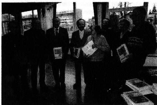
Raamatu Vastupanuvõitlus esitlus Võru Kreutzwaldi nimelises Gümnaasiumis 1. veebruaril 2008