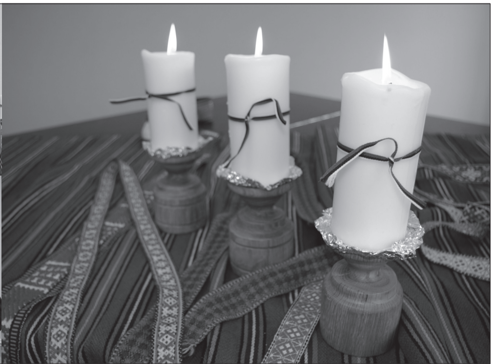
HARJU ÜLLE PILD!