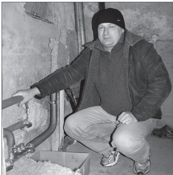
PEEDOSAARÕ KAISA PILT

«Sis om kühl halv tunnõ, ku olõt joba jupp aigu pusinu ja