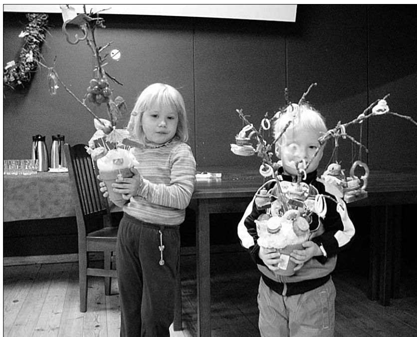
● Isadepäeval Tänassilma rahvamajas: lapsed esitlevad paremaid võileivapuid.

Vanemad võtsid meie pisikese kava aplausiga vastu. Ega me palju ei saanudki esineda, midu poleks lastel jäänud võistlemiseks aega. Algul tuli vanemal koos lapsega üks võistlus teha, seejärel moodustasime neli võistkonda ja kõik said puzzle kokkupanemises kätt proovida. Lõpuks oli veel täpsusvise: vanem lapsega ja laps vanemaga. Suuremad lasteringi lapsed olid täis-