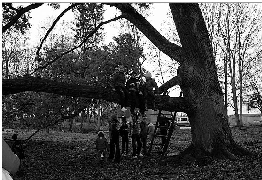
● Enne kilplaste nõukotta astumist koguneti suure puu juurde kilplaste vanne andma.