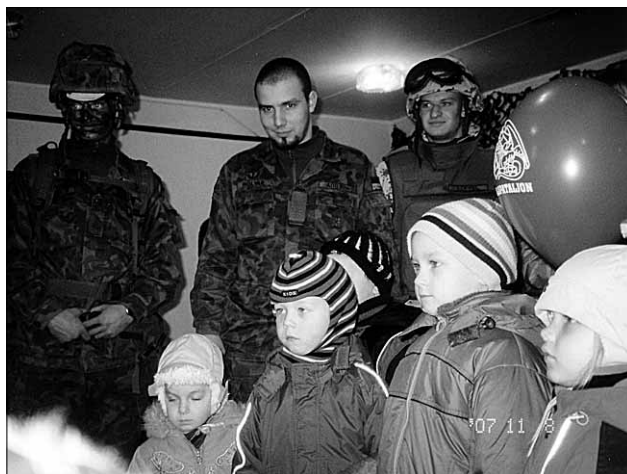
● Relva- ja vorminäitusel.