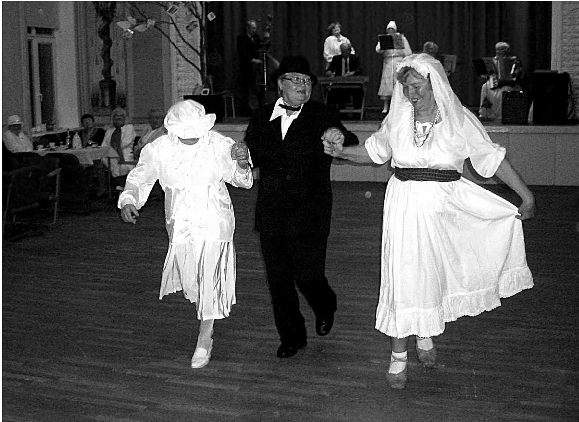
● Novembris korraldas eakate klubi Meelespea Abja kultuurimajas tujuküllase kadriõhtu.