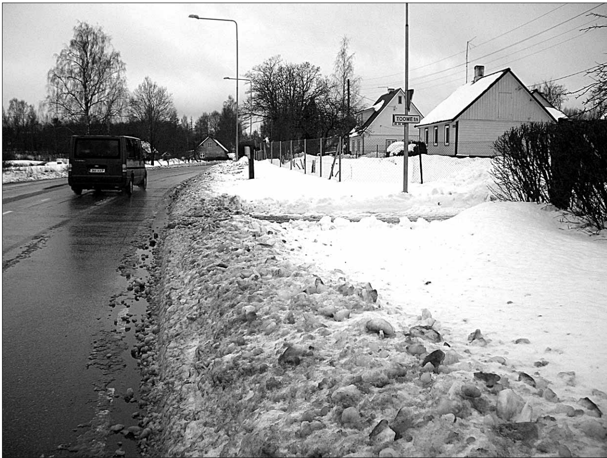
● Ootamatu novembrikuise lumesaju ja tuisu tagajärjel olid kõnniteed mitmel pool Abja-Paluoja linnas sinna sõiduteelt lükatud lume tõttu paaril päeval läbimatud.