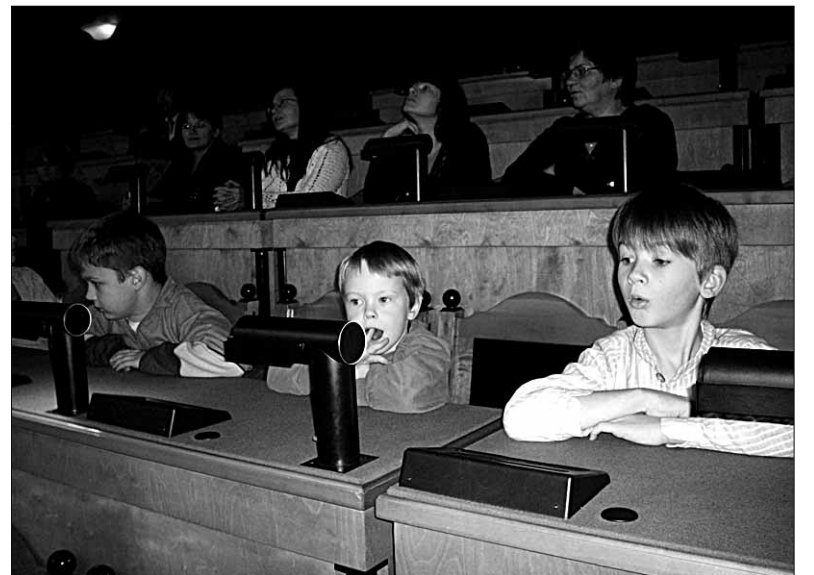
• Mõisaküla mulgi folklooriringi mudilastele tehti tänuks toredate esinemise eest ekskursioon Toompeal Riigikogu hoones. Rõdult ajakirjanike kohtadelt said lapsed uudistada ka istungitesaali.