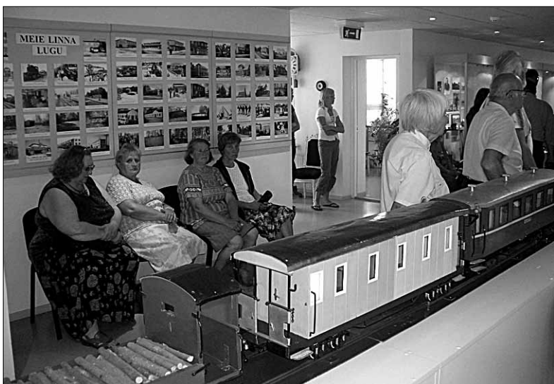
● Muuseumiaastaks valmistuv Mõisaküla Muuseum pakub külastajale lisaks püsiekspositsioonile regulaarselt vaatamiseks ka ajutisi näitusi.