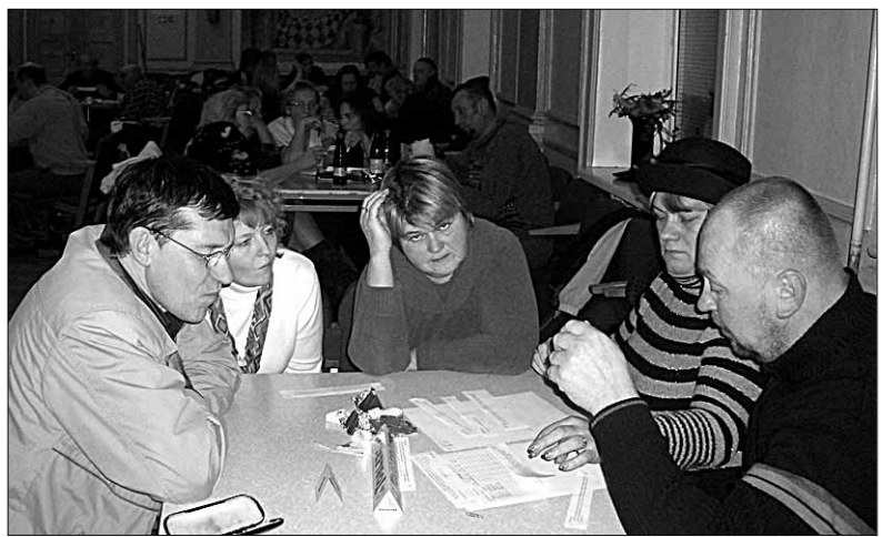
● Vana-Kariste Külaseltsi kilbavõistkond Tamme lööb edukalt kaasa Abja mälumängus. Novembris alanud uue hooaja kahes esimeses voozus saavutati esikoht.