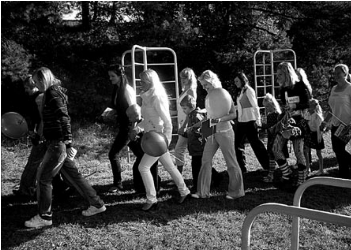
● Aktusele palliväljakule ja pärast sealt koolimajja astusid kümme Abja Gümnaasiumi esimese klassi õpilast 1. septembril traditsiooniliselt abiturientide käekõrval.