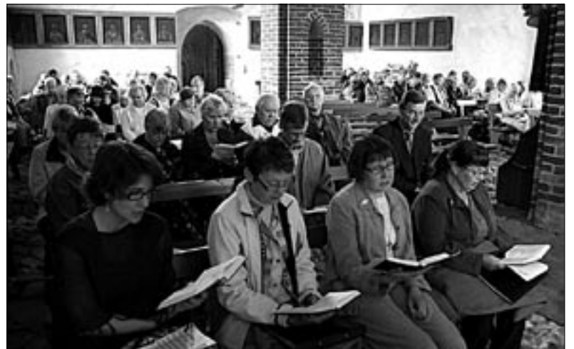
● Halliste koguduse esindus osales oma külaskäigul Sipoosse pühapäeval missal sealses XV sajandil ehitatud pühakojas, mis jättis kõigile sügava mulje.