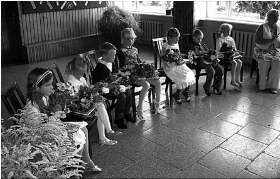
● Mõisaküla kooliperre võeti 1. septembri aktusel vastu seitse kevadel veel lasteaias käinud mudilast.