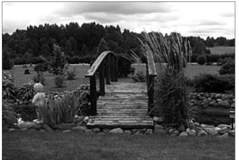
● Fotolaagris Penujas jäi piltnike objektivi ette palju sealseid kauneid motiive. Pildil oleva vaate Metsamõisa talu õuelt jäädvustas vaid 9-aastane fotokunstnik.