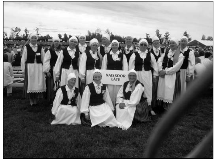
Naiskoor Lätte Soomes laulupeol.

Koju tagasi jõudes oskame nüüd paremini näha ja hinnata ka oma pidude ja peokorraldajate vigu ja voorusi. Kindlasti on kõigil Lätte laulunaistel nüüdseks juba transpordiga seotud sekkedused ununenud ja hing ootamas ülejäämise suve laulupidu Tallinnas. Nagu Gustav Ernesaks ikka ütles – laulmiseni!