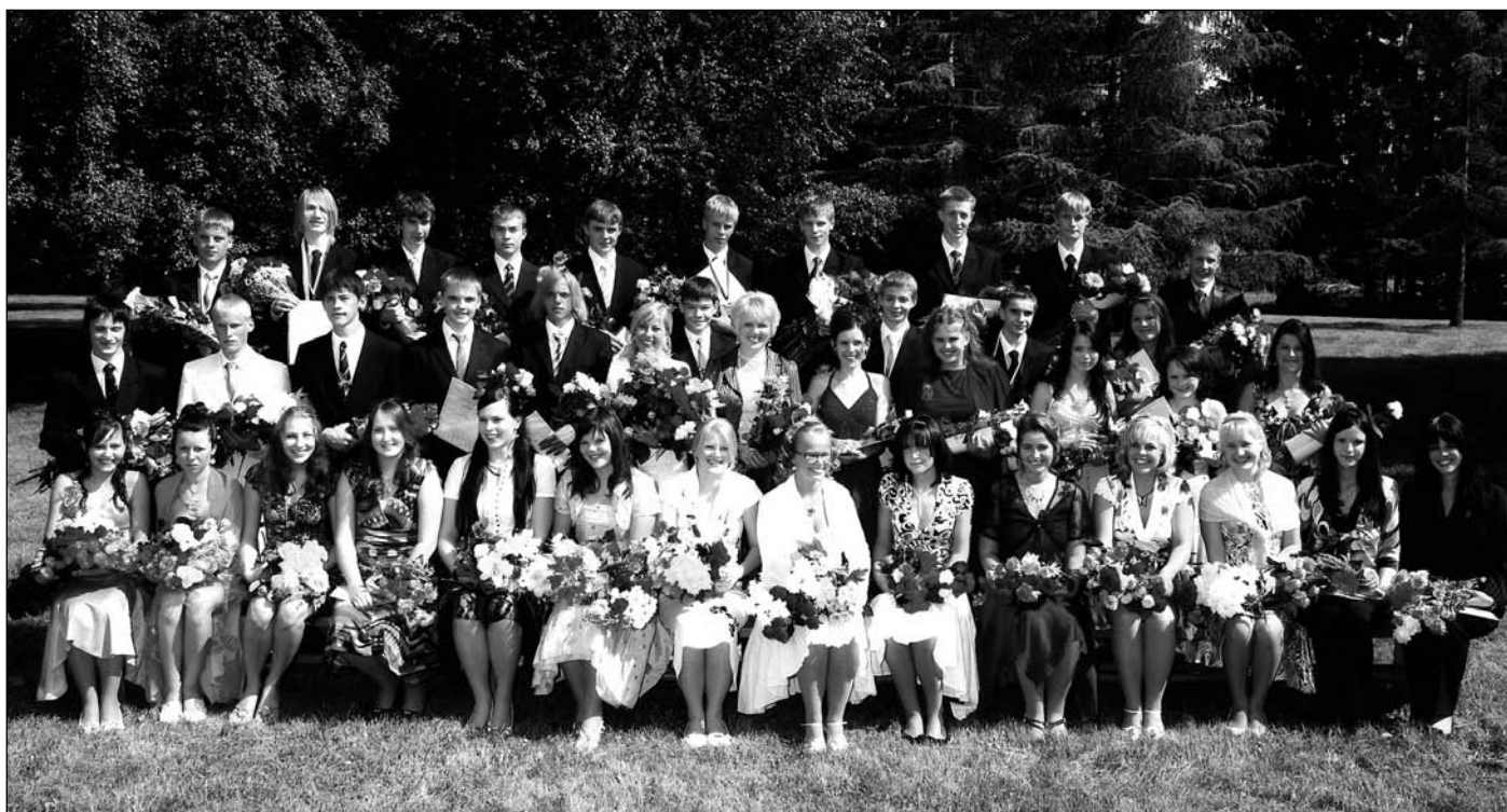
Puhja Gümnaasiumi põhikooli lõpetajad, foto Kalev Zimmermann.