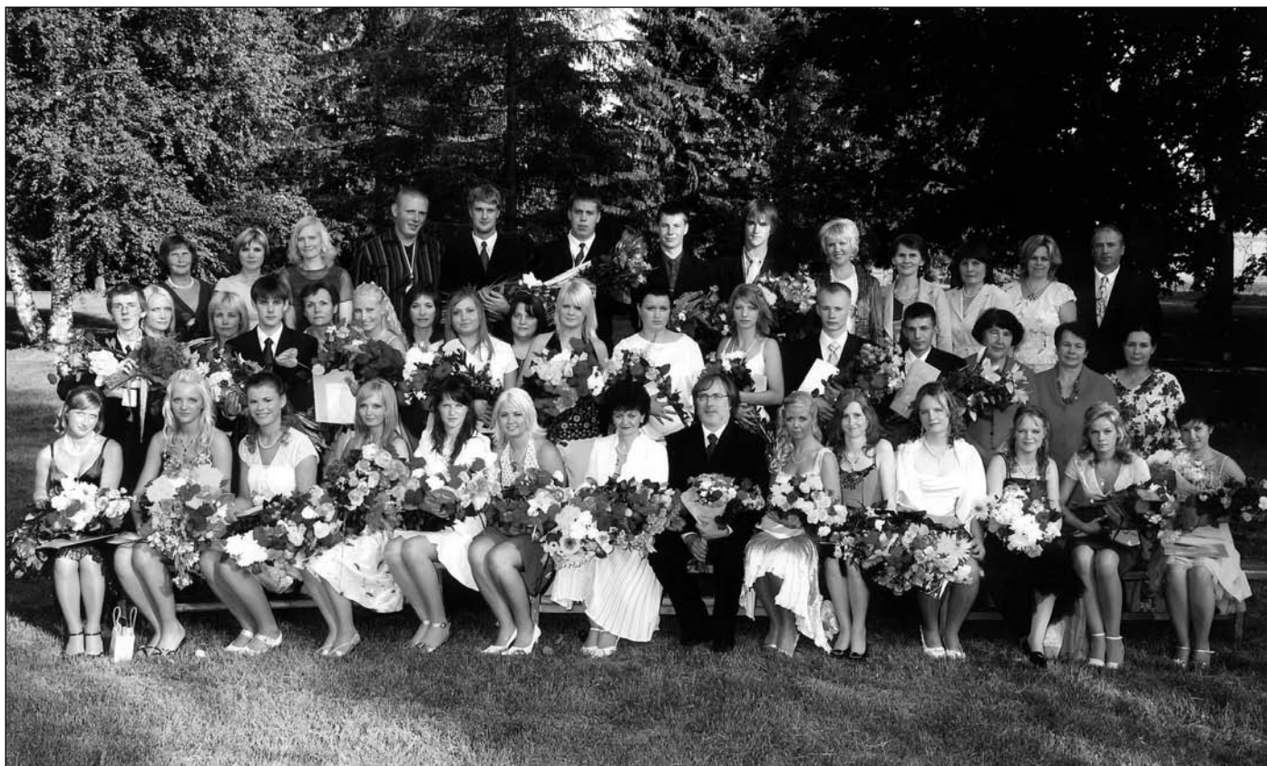
Puhja gümnaasiumi abituurium ja õpetajad, foto Kalev Zimmermann.