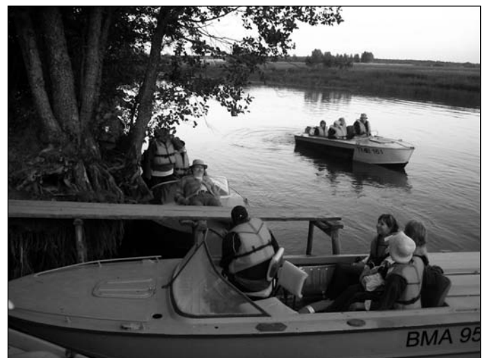
Paadid randuvad Palupõhjas.