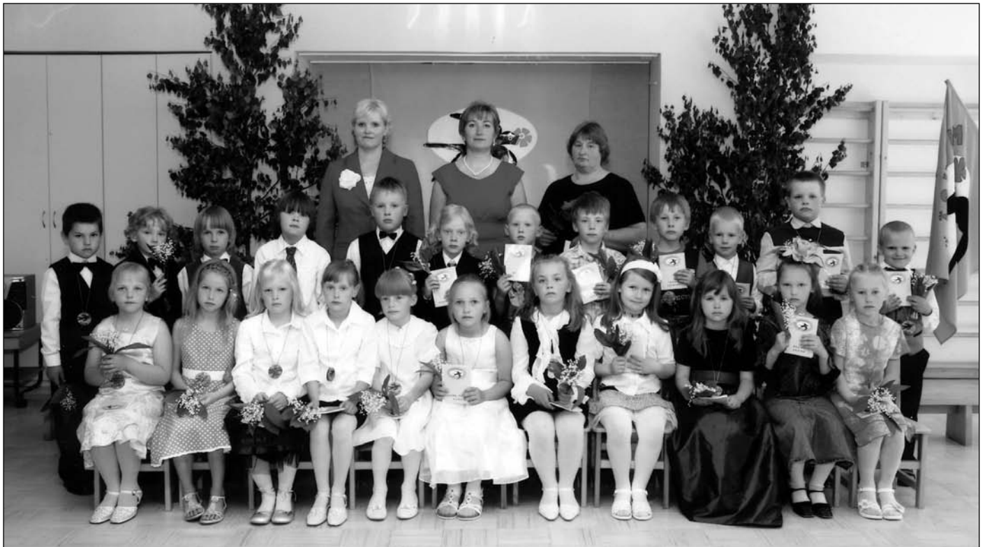
Lasteaia lõpetajad ja nende õpetajad.

Kõigile ilusat päikeserohket suve ja kohtumiseni 1.augustil kui lasteaed pärast suvepuhkust oma ukseid avab!