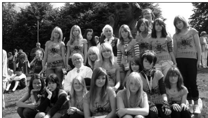
Lastekoor lauluisa kuhu juures.