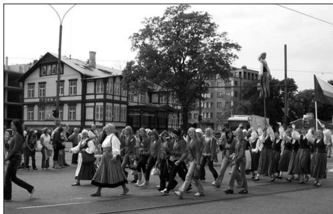
Pealtvaatajad innustasid rongkäigulisi.