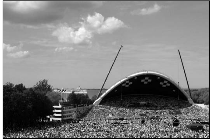
Laulupidu koondas lauluväljakule tohutult huvilisi.

mu inimesed minu rahvas mu seltskond mu inimesed siin seal kõikjal igalpool