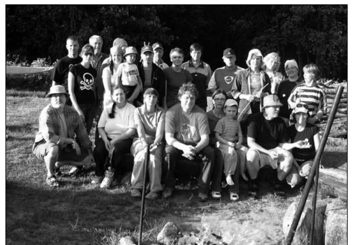
Ühispilt Palupõhja sõpradest.