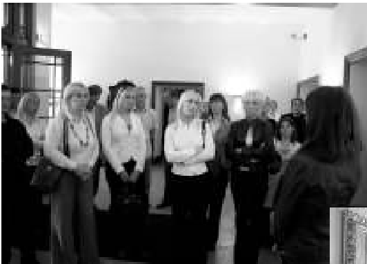
Stenbocki maja fuajees hoolega giidi kuulamas.