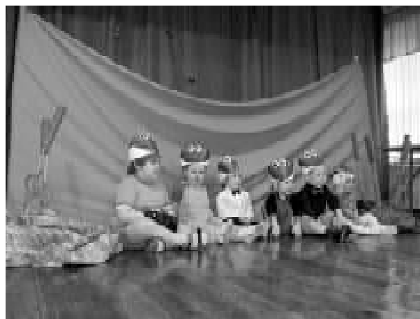
Neeme Mudila lapsed