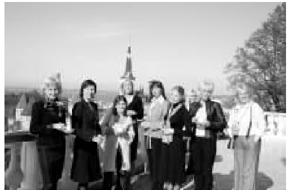
Neeme naised Stenbocki maja terrassil.