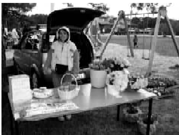
NNRS müüs lilli ja isetehtud kooke