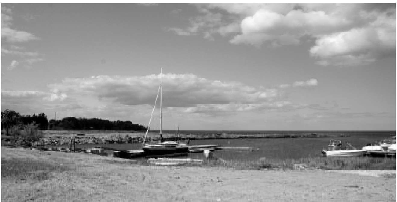
Neeme sadam juunis 2009.