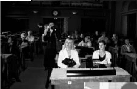
Riigikogu saalis said kõik oma lemmiku koha järgi proovida.