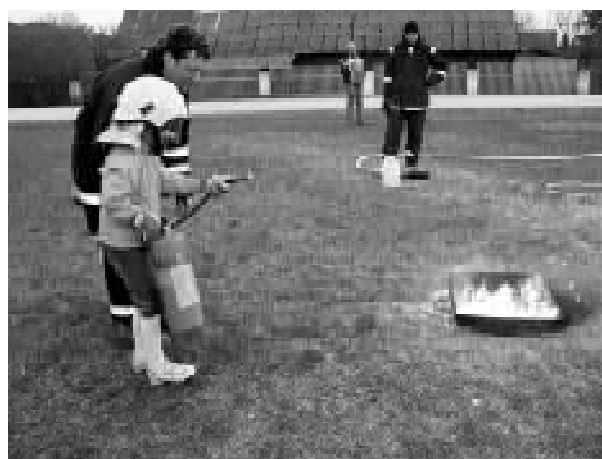
Vahukustutiga tule kustutamine