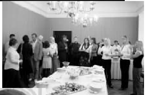
Neemekad Toompeal, mai 2009.