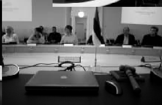
Selline näeb välja peaministri koht.