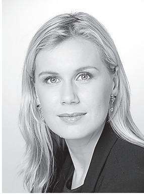
Kadri Simson, Riigikogu liige, Keskerakond

Keskerakonna algatatud astmelise tulumaksu seaduse eelnõu kehtestab praeguse ühtlase 21 protsendise maksumäära asemel kolm erinevat maksumäära ning säilitab senise tulumaksuvaba astme.