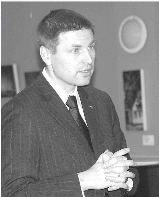
Sotsiaalminister Hanno Pevkur vestlemas raekoja saalis rahvale huvipakkuvatel teemadel.

“Kas 2011. aastal pension tõuseb, on vara öelda, seda näeme sotsiaalmaksu laekumisest ning see selgub märtsikuu teisel poolel,” ütles Pevkur. “Pension ei vähene küll, aga suurenemine ei saa olla üle 1-2