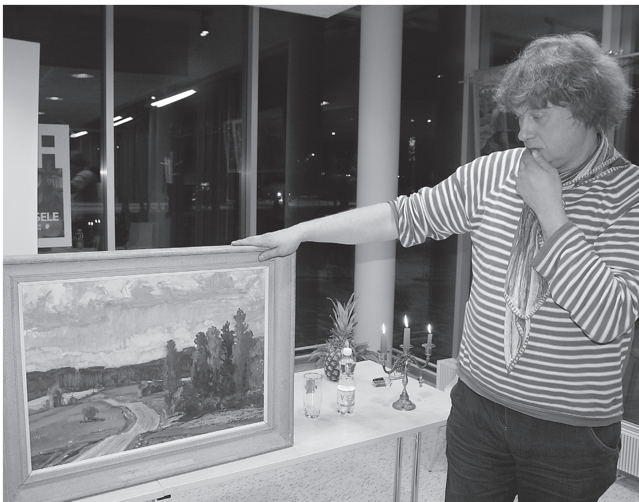
Kunstnik Juhani Püttseppa 1964. aastal valminud maal "Elva-Peedu harutee" andis nuputamisainet nii autori lapse-lapsele kui publikule.