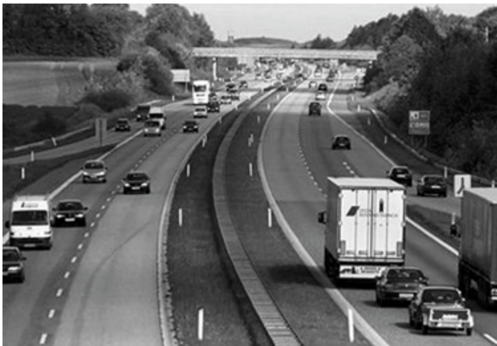
Selline näeb välja üks keskmine Taani maantee. Poleks paha, kui ka Tallinna-Tartu-Võru-Luhamaa maantee näeks kunagi välja nagu keskmine Taani maantee.