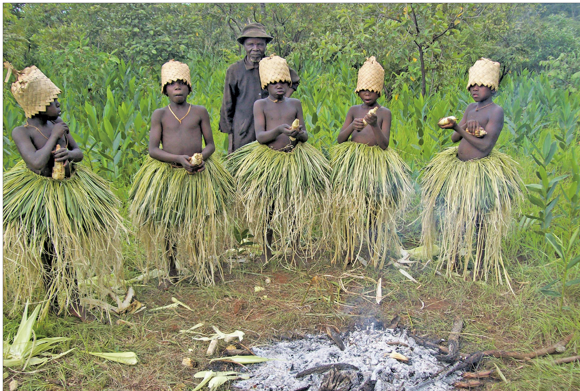
Foto filmist "Juarke – kuidas Mbouni ühiskonnas poistest mehed saavad". Tavaelus T-särke ja šortse kandvad poisid mäkkuvad rituaali ajaks ebamugavatesse taimsest materjalist seelikutesse.