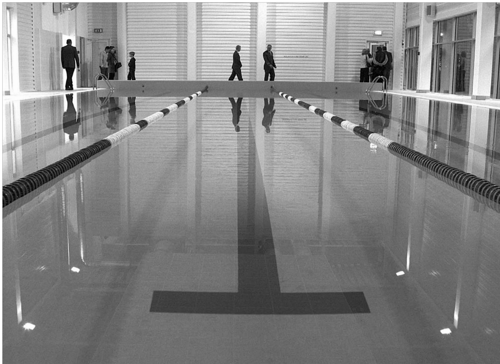
25 MEETRIT: suures basseinis saab teha nii värskendava hommikuse ujumise kui korraliku pärastlõunase trenni.