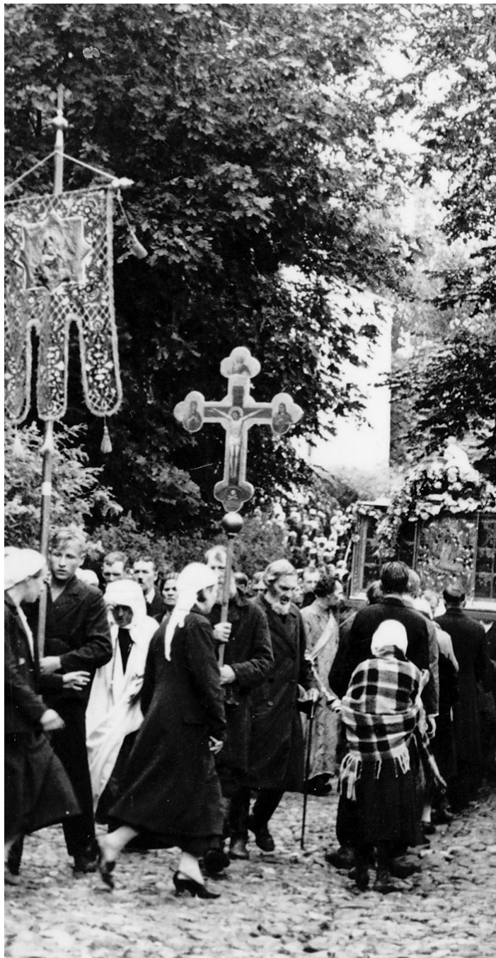
MAARJAPÄIV: traditsiooniline ristikäik Jumalaema Uinumise pühal.