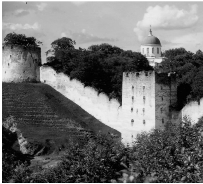
KINDLUSE MÜÜR: 9 torniga kaitsemüür valmis Liivi sõja aastatel.