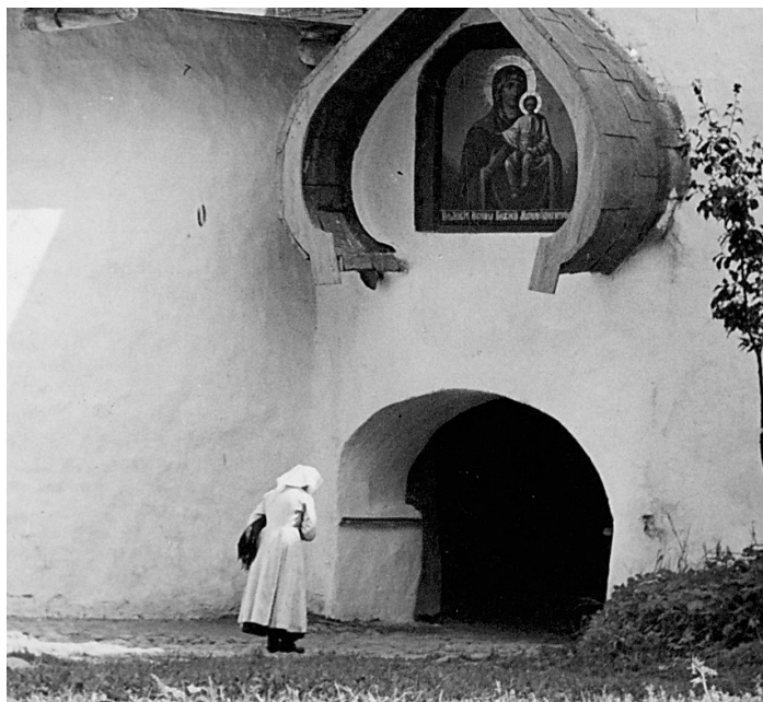
TEEB RISTIMÄRGI: veel üks setu naine on objektiivile ette näanud.