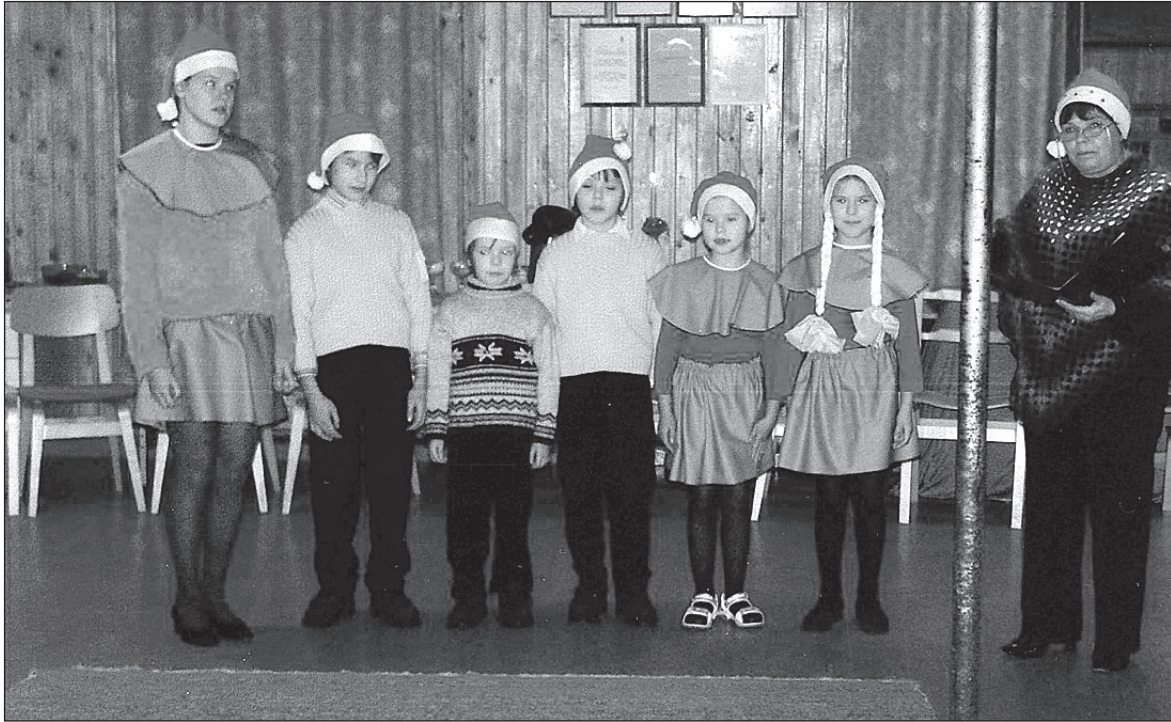
• Kärstna suurpere esineb Tuhalaanes.