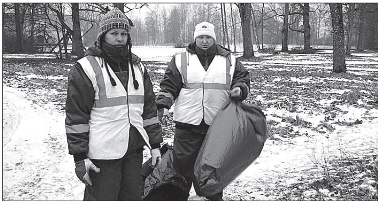
• Vallahoolduse töötajad Karksi pargis.