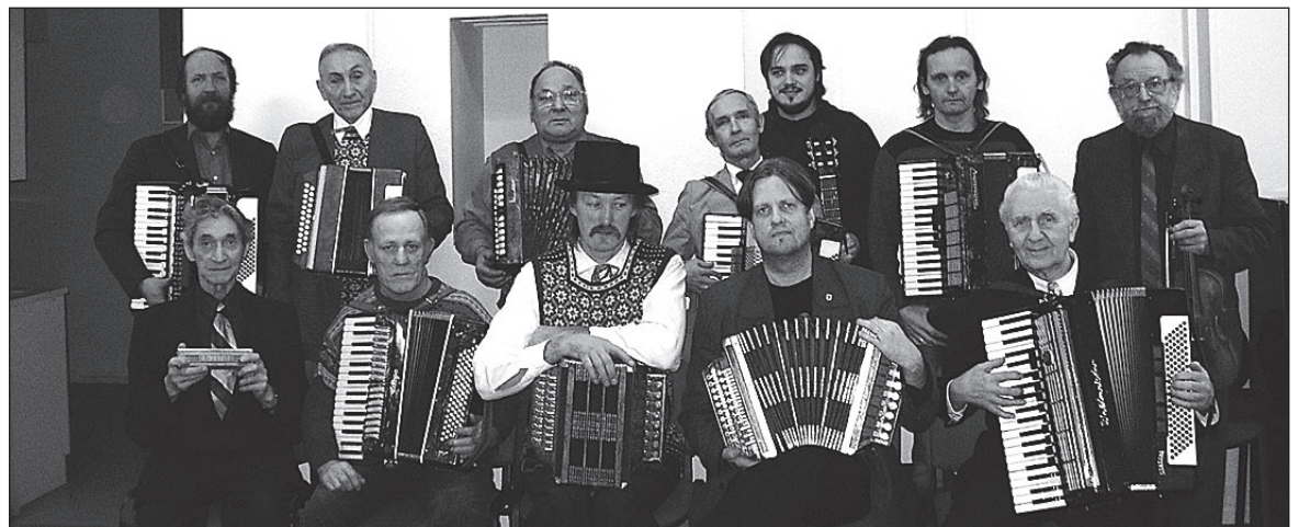
• Valla pillimehed.