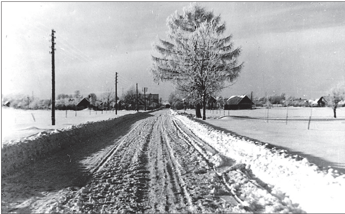
• Pakaseline (-30°C) 23. jaanuar 1955. aastal. Viljandi maantee läbib Hallistet. Lumel on näha reejalaste jäljed ja tee servas noored puud. Põline lehvis Teki talu teetsal kuivas suvel ära. 1968. aastal rajas sovhoos vasakule, Väguri talu maale suurfarmi.