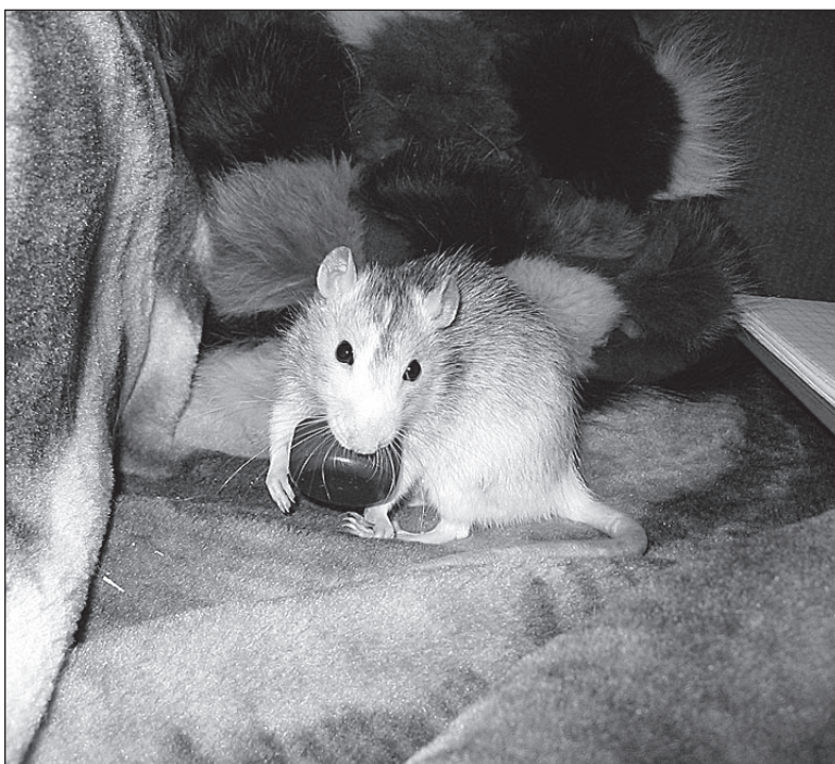
• 6. veebruaril algab roti aasta.

Isale anti luba osta elusloomade varumiskontorile hobune koos riistade, vankri ja reega. Lisaks lubati kasutada karja- ja heinamaad koos väikse metsatukaga ning kartuli- ja odrapõldu. Hobusega toime koju ka heina ja küttepuid. Ka minule õpetati hobuse etterakendamine selgeks ning