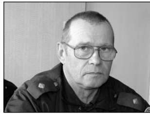
Elva politsei käis ärevatel öödel pealinnas abis. Lk 3