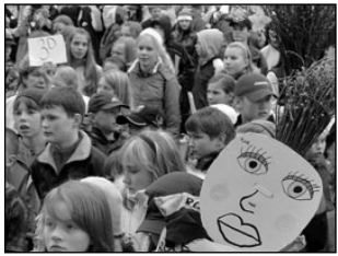
Elva parkmetsadest koguti kokku 36 kuupmeetrit prügi. Lk 2