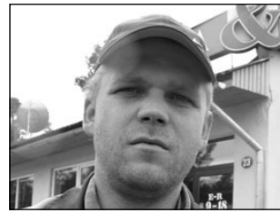
Mida arvab elvalane valitsuse tegevusest? Lk 4