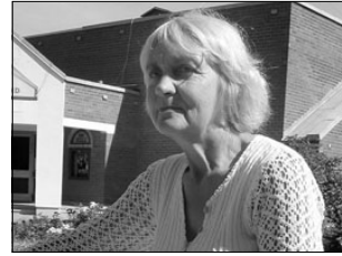
Linnalaagriga jäid rahule ka lapsevanemad. Lk 5