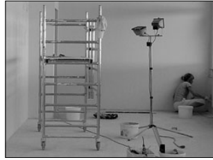
Elva koolis remonditakse tänavu viie miljoni eest. Lk 3