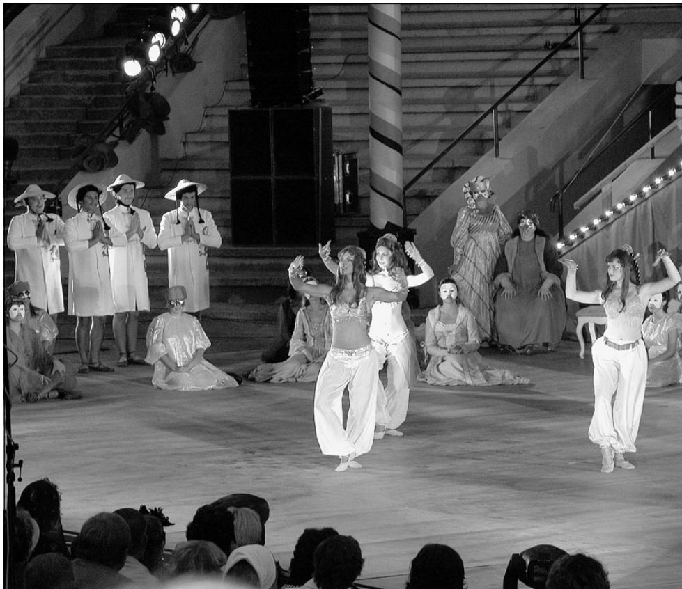
Õisel maskipeol esitasid rahvatantsurühma Tarbatu naistantsijad muu hulgas ka Arabia tantsu Tšaikovski balletist "Pähklipureja".

"Meie imestuseks astus keset lugu üks orkestrimees koos pilliga lavalt alla ja jalutas minema. Teised järgnesid ka tasapisi, aga muusika mängis edasi – taipasime, et lindilt ju," seletasid tantsuhuvilised