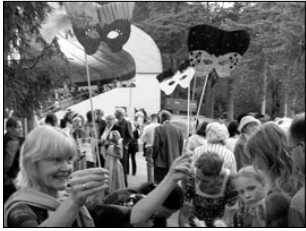
Elva lauluväljak muutus üheks öhtuks tõeliseks Venetsia karnevaliks. Lk 2