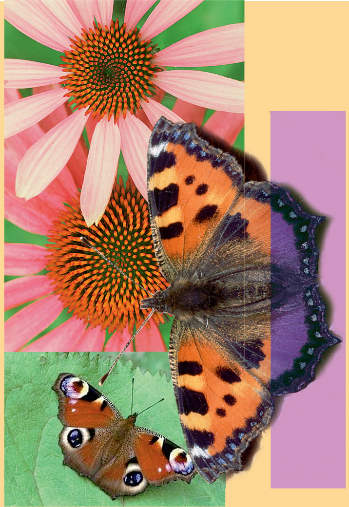
KODUAIA KAUNITARID. Koerliblikas ja päevapaabu-silm ning liblikate suur lemmik - punane päevakübar.