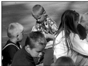
Baptistikogudus korraldas vähekindlustatud lastele tore päeva. Lk 3