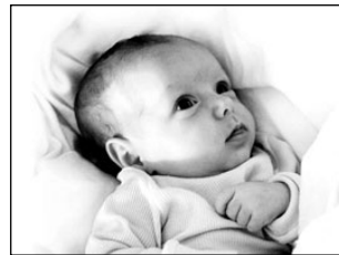
Ülevaade peretoetustest ja seadusemuudatustest. Lk 4