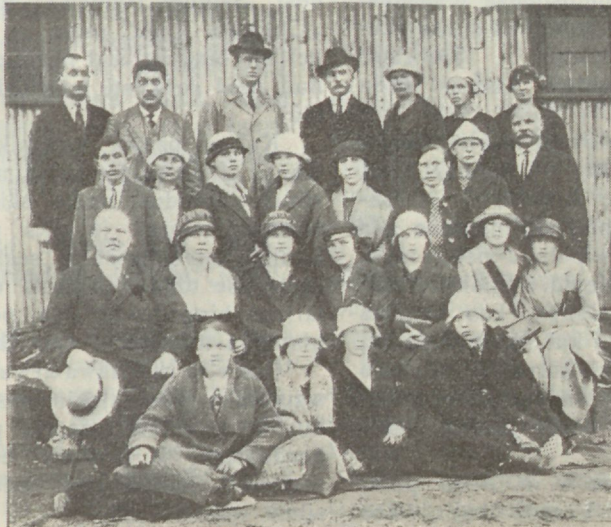
Narwa C. E. lasti Kohtlas.

Juba nädalaid oli selle wastu walmistatud, et suuremat noorte koosolekut pidada Kohtla kaewanduses. 29. juuni hommikul ruttasime jama ja peagi wuras rong Kohtla poole. Seal ootas meid kitsarööpeline kaewandusrong, eraldi meie jaoks ühe lahtise põlewkiwi-waguniga. Mõneminitulise sõidu järele peatus rong ja meie ees awanes lai põlewkiwi kaewandus, kus wõisime lauluga terwitada sealset wend Kriwelgotti. Eemalt paistab juba silma uus kõrge õliwabrik ja selle ümber mitmesuguses sti-