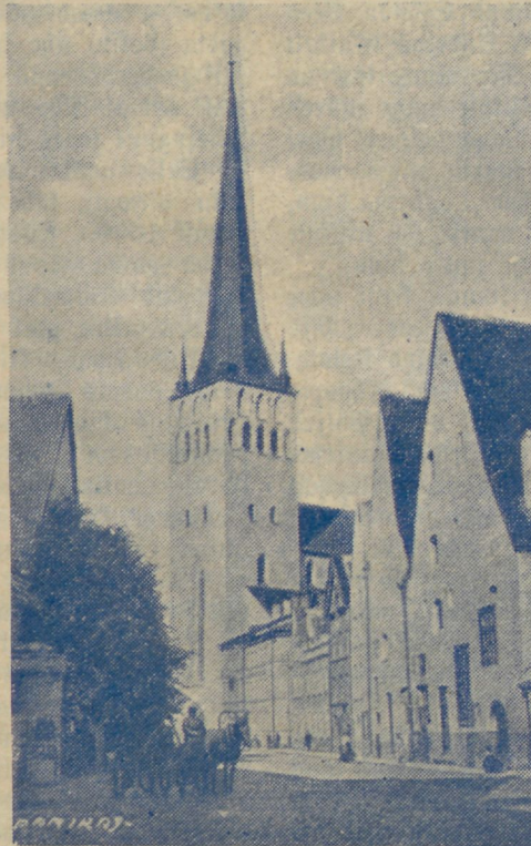
OLEWISTE KIRIK, mida tabas pikne 27. juulil põlema süüdates torni.

Delbud, tehtud. Waewaga saabub ta ujuwa palgi juurde, wõtab wiimse