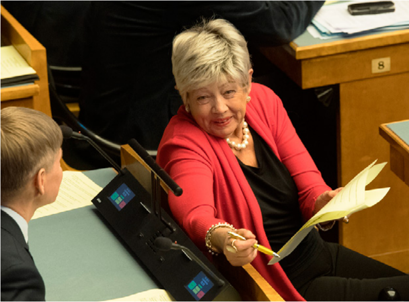
Ivi Eenmaa XIII Riigikogus, veebruar 2019