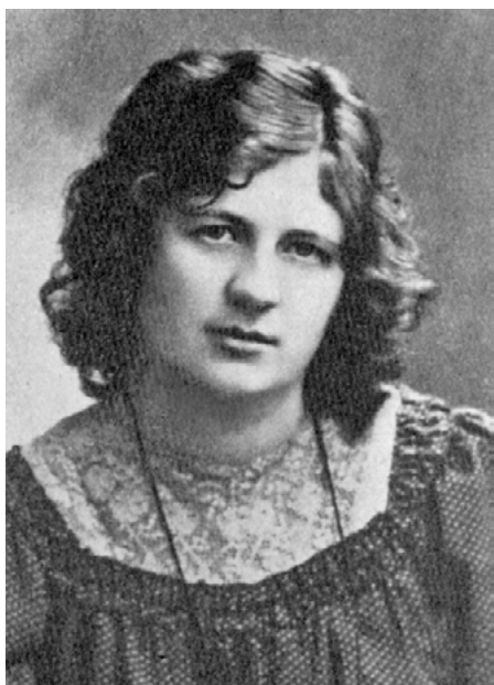
M. Kurs-Olesk Inglismaal 1904. a. Foto: Minni Kurs-Olesk . Tallinn, 1939, lk 17