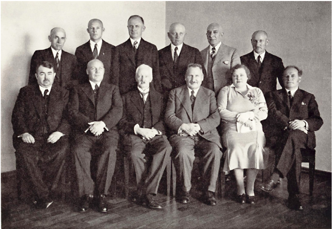
Rahvuskogu Teise Koja Põhiseaduse eelnõu-osa III komisjon.

Naiskodukaitse , 15, 143–144, 154; Nemvalts , 65, [72]; NOPA3 , 390; Paramonov , 178; PsRk , 272–273 vaheleht; Vjv , 68, 240; IA100 , 2017, 94; Jutuleht 1939, 15.11., 5; Kaitse Kodu , 2012, nr 4, 52–53; KLTMT 1931, nr 39, 191; Pvl 1939, 17.10., 7; RaK 2. koosolek , 5; RaK 6. koosolek , 87, 94; RaK 16. koosolek , 230–231; Teataja (Nissi) 2012, 01.06., 7; UE 1937, 09.01., 3; 06.11., 8; VE 1979, 06.03., 4; EAA.3149.1.40 , 11; EAA.3149.1.102 , 118; EAT2 , EKLA , f.193, m.75:15; EFA.36.A.103.85 ; EFA.141.0.57933 ; EKLA , C-181:504; ERA.1.3.1171 ; ERA.1.3.1172 ; ERA.77.2.233 ; KL 327_tln ; KL 328_tln ; KL 330_tln ; KL 332_tln ; KL 336_tln ; KL 337_tln ; KL 345_tln ; KL 350_tln ; TLA.186.1.87 , 23; TLA.1359.2.38 , 19; TLA.1359.2.45 , 107; TLA.1376.1.79 ; Haudi