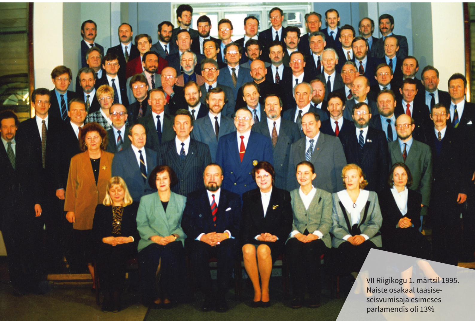
VII Riigikogu 1. märtsil 1995. Naiste osakaal taasise- seisvumisaja esimeses parlamendis oli 13%