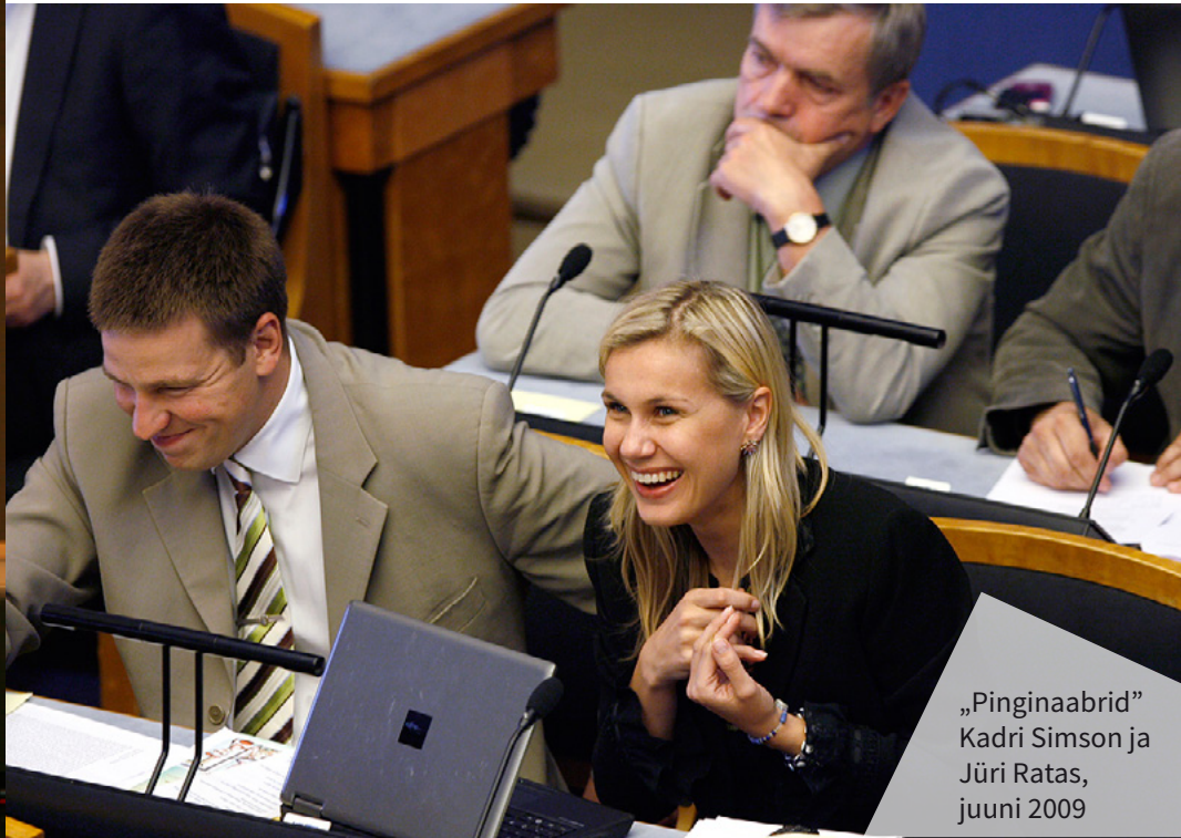
„Pinginaabrid” Kadri Simson ja Jüri Ratas, juuni 2009