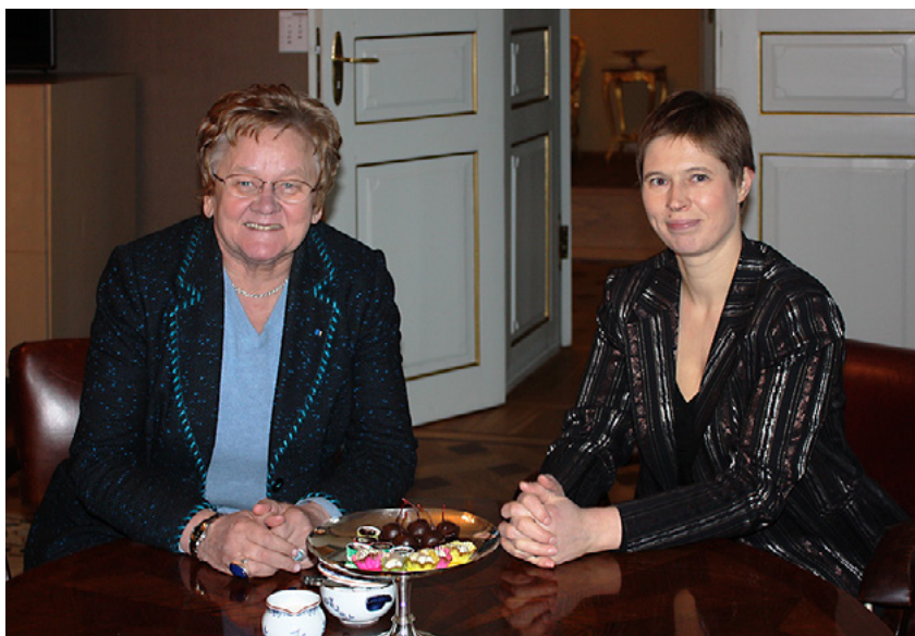
Riigikogu esimehe Ene Ergma kohtumine Euroopa Kontrollikoja liikme Kersti Kaljulaidiga, jaanuar 2011

Naiste rollist poliitikas on Ene Ergma arvanud, et loomulikult oleks naisi poliitikasse rohkem vaja, Riigikogus võiks neid olla 40, sest meil ei ole ühiskonnas meeste-naiste suhe 80% ja 20% nagu parlamendis. Aga naisena poliitikamaailmas meestega rinda pista pole lihtne: mehed tahavad kangesti juhid olla. Meeste maailmas läbilöömiseks peab olema tugev iseloom, siniste silmade ja leebe olekuga sinna kauaks püsima ei jää. Ergma arvates on meeste ja naiste põhiline erinevus enesehinnangus. Meestel on see sageli põhjendamatult kõrge; tark naine määratleb end täpselt ega püüa kõiges tugev olla. Teisalt on mehed valmis riskima, naistel on alalhoiuinstinkt tugevalt sees, nad püüavad pigem konsensuseni jõuda.