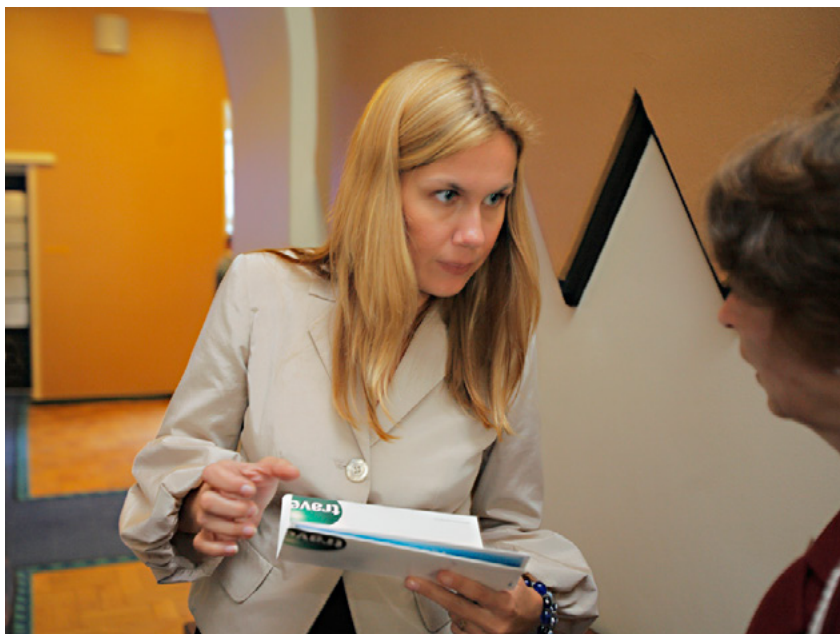
Kadri Must poliitikutee alguses, september 2007

101 lühielulugu : Riigikogu XI koosseis . Tallinn, 2007, lk 58; Riigikogu XII koosseis . Tallinn, 2011, lk 94; Riigikogu XIII koosseis . Tallinn, 2019, lk 148.