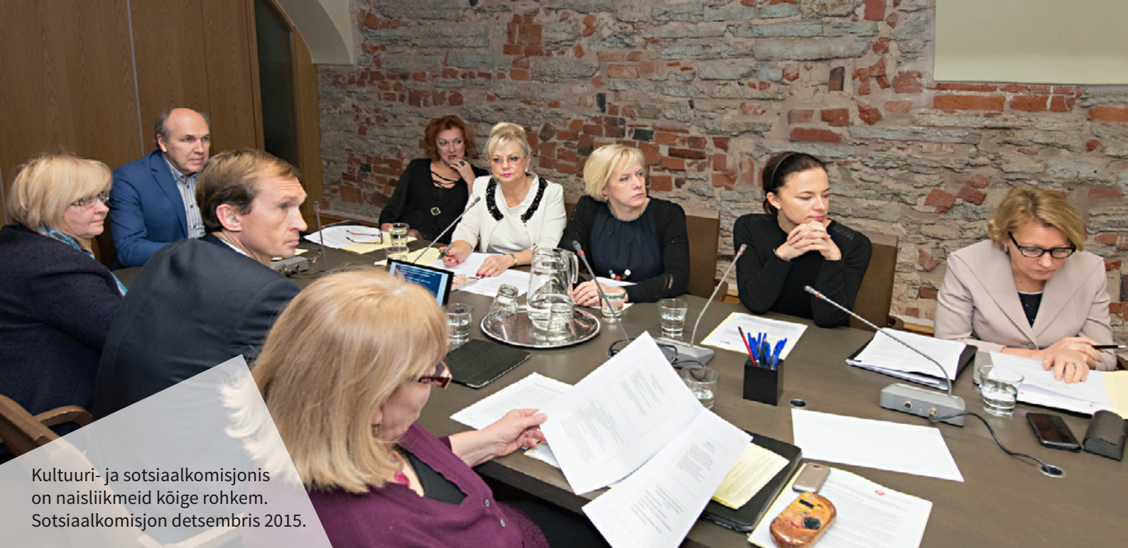
Kultuuri- ja sotsiaalkomisjonis on naisliikmeid kõige rohkem. Sotsiaalkomisjon detsembris 2015.