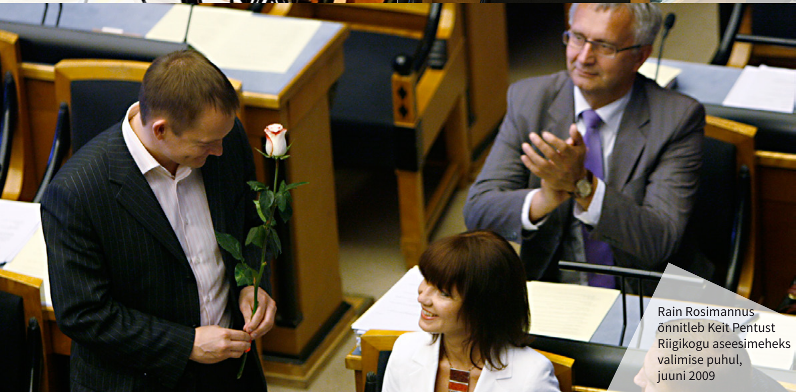
Rain Rosimannus õnnitleb Keit Pentust Riigikogu aseesimeheks valimise puhul, juuni 2009