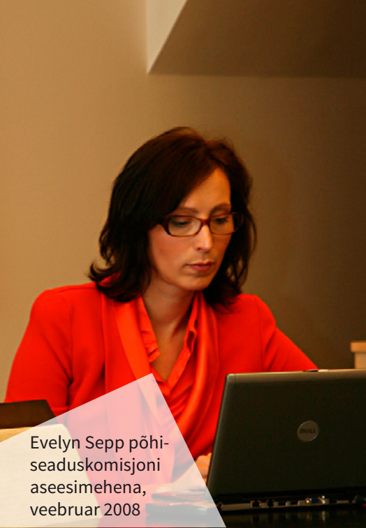
Evelyn Sepp põhi- seaduskomisjoni aseesimehena, veebruar 2008