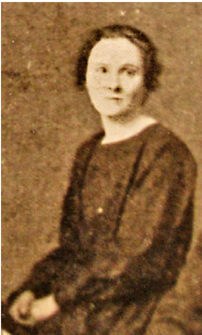
[Fragment]