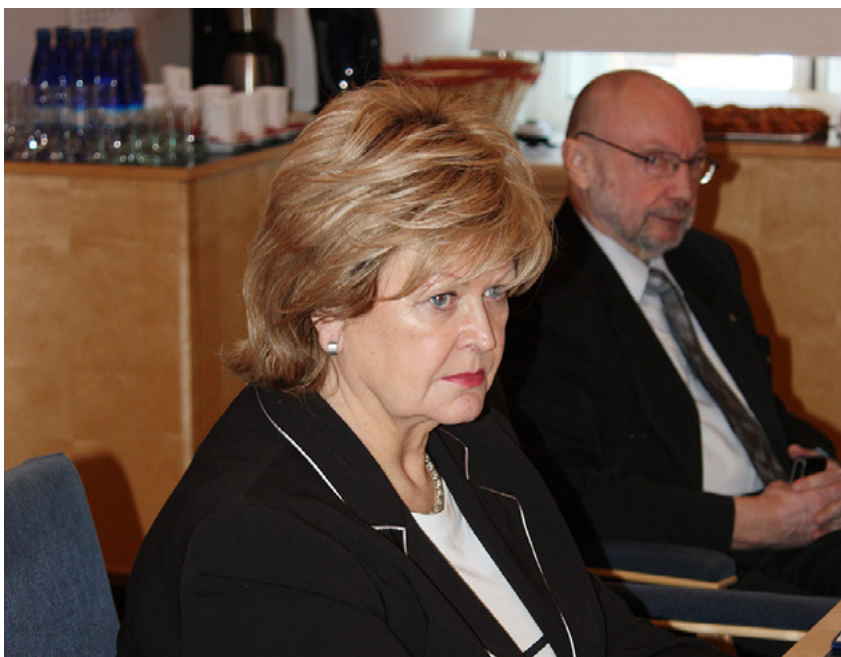
Nelli Privalova riigikaitsekomisjoni istungil, veebruar 2011