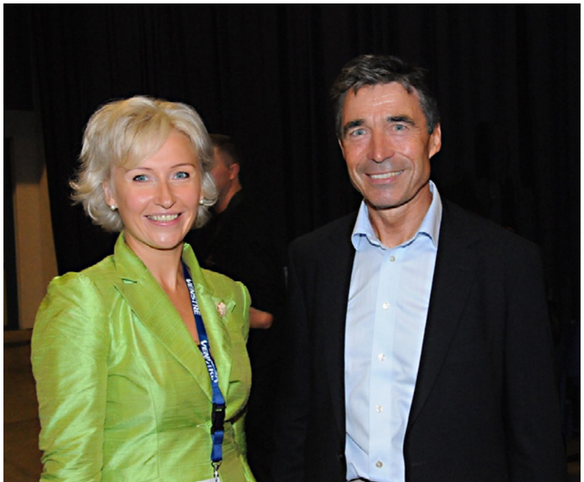
Kristiina Ojuland on valitud viide Riigikogu koosseisu. Koos Anders Fogh Rasmusseniga, august 2008.

Maailm ja meie : [Eesti välisministrite kõned ja sõnavõttud]. Tartu, 2018, lk 233-263.