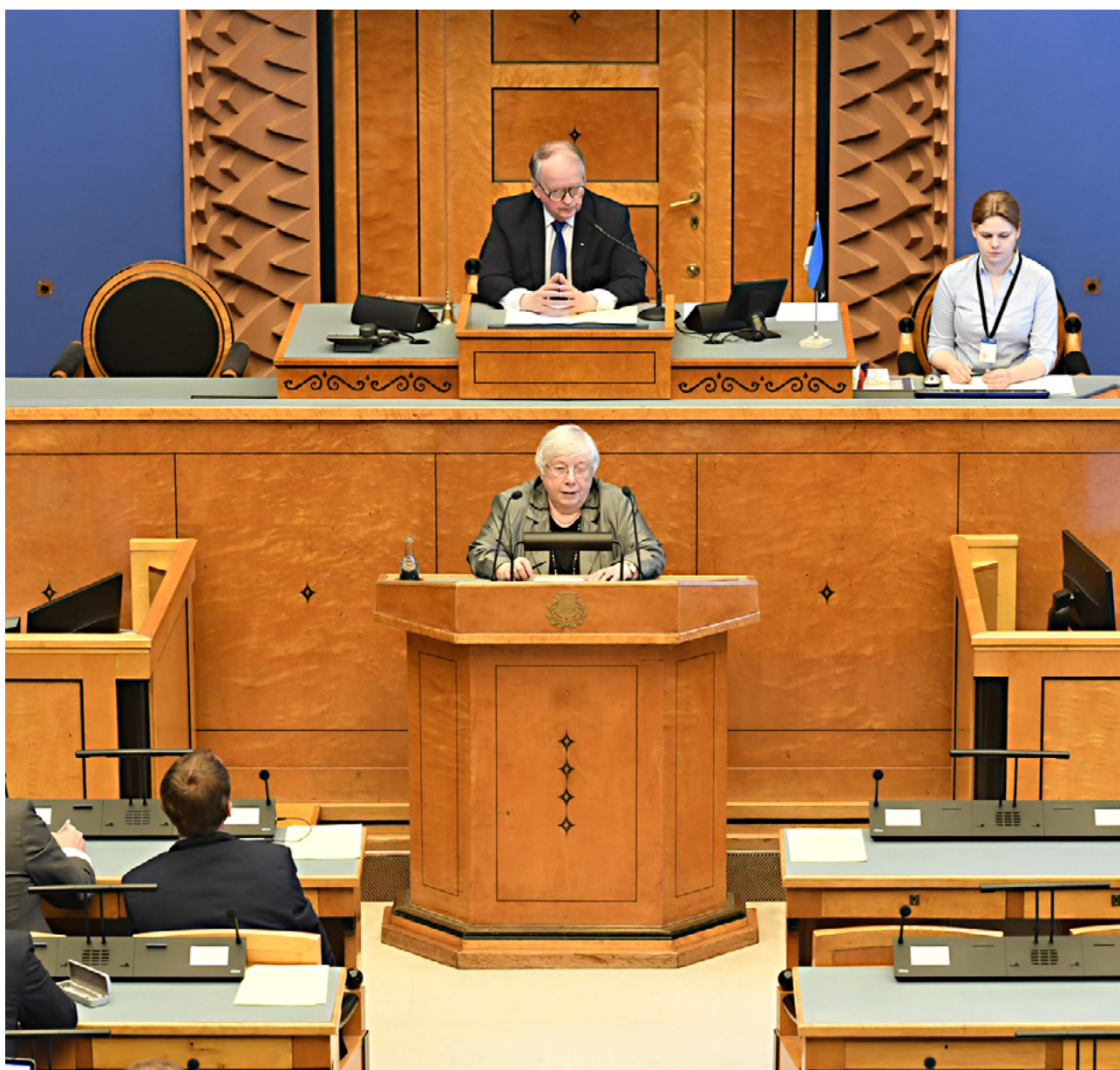
Euroopa Parlamendi liige professor Marju Lauristin XIII Riigikogu arutelul „Eesti demokraatia ohud ja väljakutsed”, september 2017

Lauristin, Marju jt. Marjustini sajang: kõnelused Marju Lauristiniga elust, Eestist, Euroopast. Tallinn, 2016.