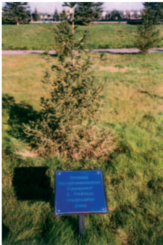
Atamekeni mälestusmärki ümbritsevas pargis kasvab ka president Arnold Rüütl istutatud kuusk

2005. aasta lõpul näiteks külastas Eestit kasahhi lasteansambel: osalemaks laulufestivalil „Jõulukohtumised 2005“.