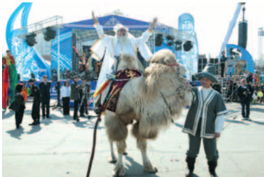
Kasahh ja kaamel – rännakul lahutamatud sõbrad

Kolmas oletus ütleb, et kasahhidele on nime andnud Kasahstani kunagisele territooriumile asustatud vangid. Neid nimetati küll „sakid“, „kaspid“, „hasaarid“, „asid“. Ajapikku muutsid sõnad oma kuju ja neist moodustuski „kasahh“.