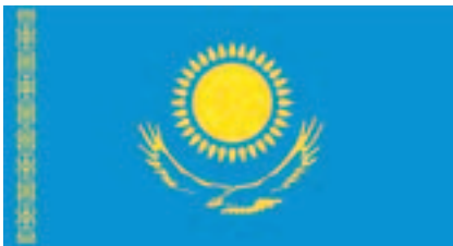
Kasahstani Vabariigi lipp

Kasahstani Vabariigi vapil on helesinisel taustal kujutatud jurtat, täpselt selle ülemist osa. Sellest hargnevad kui päikesekiired sümboolselt jurta seinasõrestiku moodustavad teljed, mis omakorda on raamistatud mütoloogilise hobuse tiibadega.