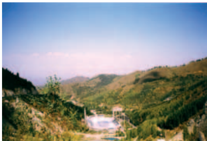
Medeo staadion on populaarne paik maailma kiirusutajate seas

Huvitav on see, et aasta-aastalt on kasahhide huvi nende ammuste spordialade vastu kasvanud. Samas on Kasahstanis mõistagi au sees ka tipp-sport. Populaarsemad alad on jällegi poks, maadlus, sambomaadlus. Olgu siinkohal näiteks Serik Konakbajev, Euroopa meister ja maailmakarikate võitja poksis: mees, kel oma kaalukategoorias õnnestus esimese sportlasena maailmas alistada Kuuba poksija. Või Daulet Turlõhanov, kes kreeka-romma maadluses on kahel korral jõudnud olümpiapjedestaalile. Kasahstan