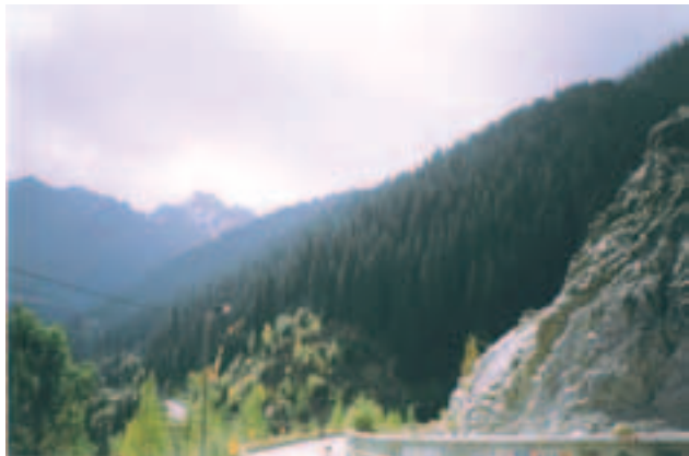
Tian Shan, Abai mäetipp

Kasahstan on ka üks väheseid riike maailmas, mis võib uhkust tunda oma kosmonautide üle. Pärast iseseisvuse saavutamist 1991. aastal käib iga 3–4 aasta järel kosmoses ka üks selle riigi esindaja. Kasahstani teadlased ja spetsialistid on ette valmistanud ja edukalt ellu viinud neli uurimisprogrammi rahvusvahelise orbitaaljaama „Mir“ pardal. 2007. aasta lõpuks moderniseeritakse Astanas asuv kosmilise monitooringu rahvuslik keskus ja Bajkongõri kosmodroomil lõpetatakse tööd kosmosekompleksi „Baiterek“ loomisel.