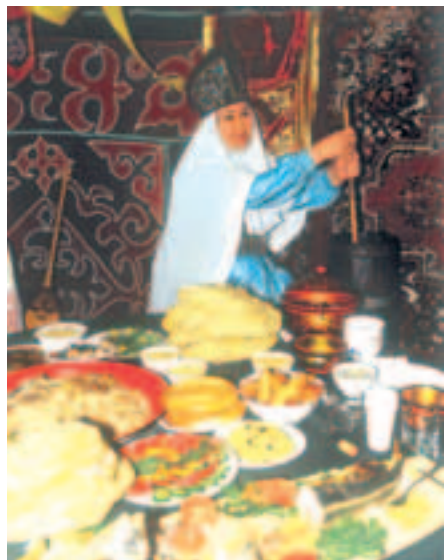
Kasahhi rikkalik peolaud

Seejärel asetatakse lauale järgmine toit, mis koosneb lihast ja õhukeks rullitud keedetud taignast. Kusjuures liha on kombeks anda lauale koos kontidega. Külaliste silme all hakkab peremees rooga lahti lõikama ja jagab siis aromaatselt lõhnavaid lihaga kondikesi kõigile laua ümber istujatele. Ja jällegi on oluline, millises järjekorras toitu pakutakse ja missuguse tükikese keegi saab. Vaagna- ja küljeluud näiteks on määratud vanematele ja eriti austatud külalistele. Põhjus on lihtne – suuremad ja maitsvamad lihapalad on mõeldud eelkõige neile. Rinnatükid lähevad miniale või väimehele. Kaelakondid – abielunaiestele ja tütarlastele.