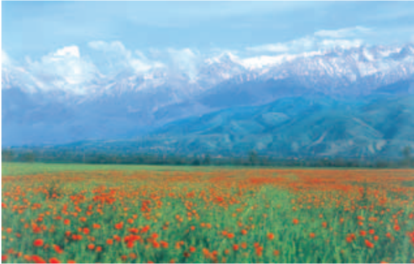
Otsatu lillepõld ja taamal mäed – Kasahstanile nii iseloomulik loodus

Läänes uhuvad Kasahstani rannikut Kaspia mere lained. Nagu teada, on Kaspia puhul tegu maailma suurima järvega, mida just suuruse tõttu nimetatakse mereks. Hüdroloogide ja arheoloogide uuringud kinnitavad, et Kaspia on pulseeriv veekogu, mille tase sajandite jooksul on kord tõusnud, siis jälle langenud. 1978. aastast on see pidevalt tõusnud: 13–14 cm aastas, mis kokku teeb juba 2,5 meetrit. Kaldajoon on seetõttu 30 aasta jooksul nihkunud 20–40 kilomeetrit. Teadlaste arvates tõuseb Kaspia mere tase veel 25–30 aasta jooksul. Veekogu on unikaalne rikkalike kalavarude poolest. Järves peituvad suured nafta- ja loodusliku gaasi varud.