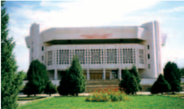
Tudengid armastavad aega veeta al-Farabi nimelise ülikooli üliõpilaspalees

Nii ehk teisiti – Almatõs kannavad õunapuud isuäratavaid vilju tänaseini. Ja äärelinnas liikudes võib ikka ja jälle tunda õunaaiale nii iseloomulikku mesimagusat hõngu.