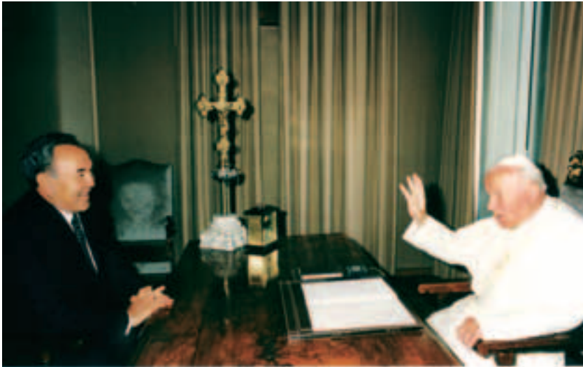
Kasahstani Vabariigi presidendi Nursultan Nasarbajevi ja paavst Johannes Paulus II kohtumine