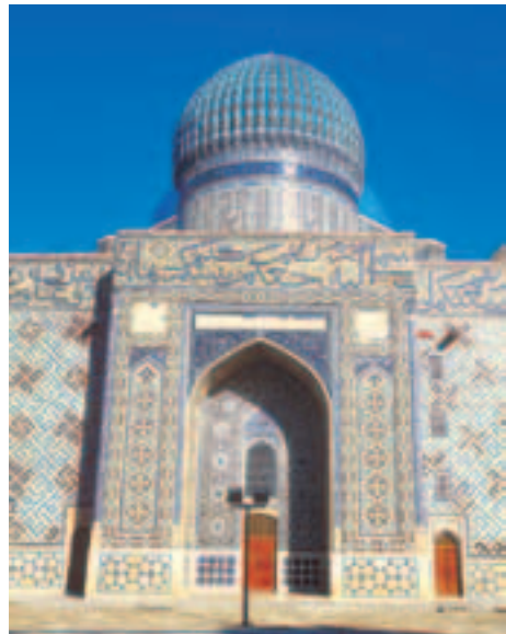
Hodža Achmed Jassau mausoleum

Üks viiest islami käsust, mille täitmine on kohustuslik igale moslemile, on palverännak Mekasse. Seda võib asendada vaid Hodža Achmed Jassau mausoleumi kolmekordne külastamine. See näitab, kui oluline koht on moslemimaailmale Türkistan. Olgu lisatud, et Türkistan on tähtsuselt kolmas islami püha linn.