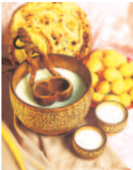
Kasahhi köök pakub rohkesti hõrgutisi

Hirss praetakse seda pannil kergelt liigutades üle, lisatakse või ja tuhksuhkur. Serveeritakse tee juurde.