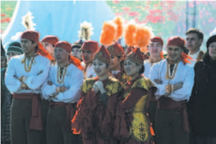
Rahvarõivaid kantakse pidulikel puhkudel ka praegu

Nahast vööd kaunistati sageli hõbedaste kujutiste või inkrusteeritud poolvääriskividega.