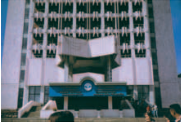
Al-Farabi nimelise Kasahhi Riikliku Ülikooli peahoone