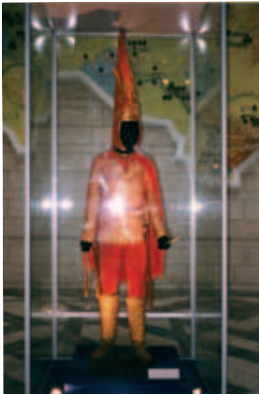
Kuldse Sõdalase rüü on kohti sisse võtnud Almatõ ajaloomuuseumis

Mõnel juhul pandi hauda kaasa teisigi tulevaseks eluks vajalikke esemeid: tasse või anumaid jookidega, isiklikke relvi, igapäevaseid tarbeesemeid. Oma juhiga koos maeti vahel isegi tema orje, armastatud naise, hobuseid, koeri.