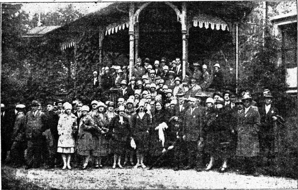
Huvireisijad Läti ajakirjanikkude kodus, Siguldas.