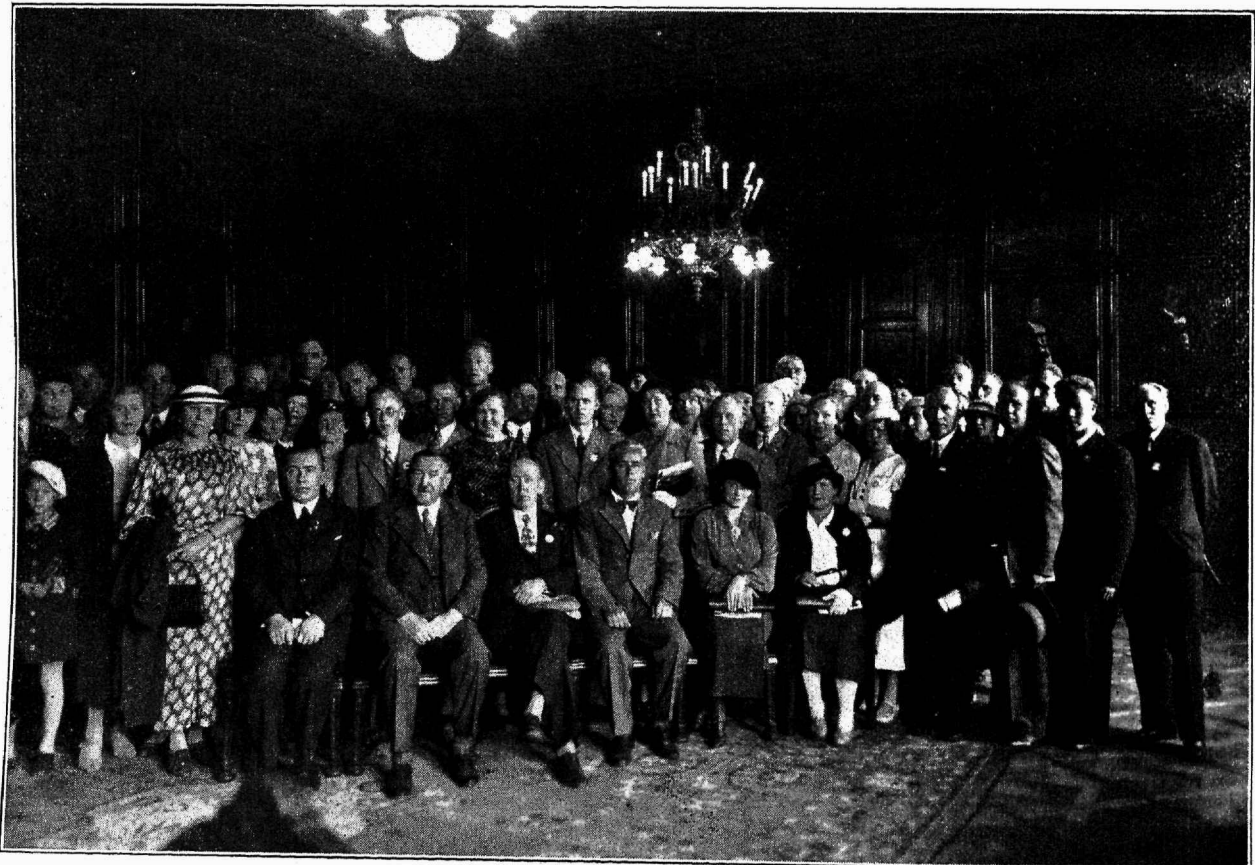
Ekskursandid vastuvõtul Praha raekojas.