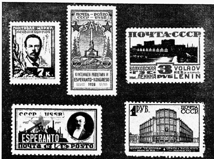
Esimesed esperantokeelse tekstiga p.-margid.

Postiteenistus on suurelt osalt rahvusvaheline, ulatudes üle riikliste ja keeleliste piiride. Sellest olenedes sageli sellel alal esineb vajadus ühe ja teise keele mõistmiseks, millede õppimine aga suurte raskustega ühenduses, sest keeli on ju palju. Kui võtta aga postil üleilmiselt tarvitusele kellegi teatava rahva keel, siis jälle pole see loomulik, sest sellega asetatakse tähendatud rahva keel mingisugusesse eesõigustatud seisukorda. Loomulik olukord on see, kui niisuguse rahvusvahelise ala jaoks tarvitatakse ka iseloomult rahvusvahelist ja erapooletut keelt, milleks osutub esperanto. Seni mitmesugusil põhjusil aga — millede arutamine ei kuulu praegu siia — seda keelt selleks veel tarvitusele võetud ei ole. Siis-