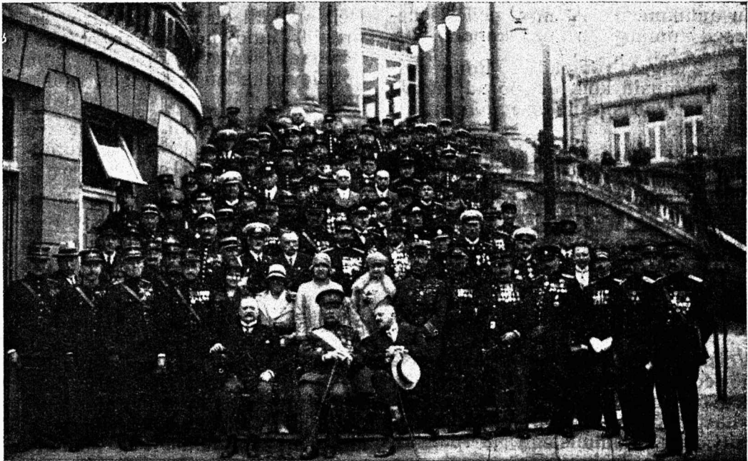
Belgia Tuletõrje Liidu kongressist osavõtjad, Spas 15. juuni.

14. juunil kell 6 õhtul panid nende rahvuste esitajad, kes Spa tuletõrje