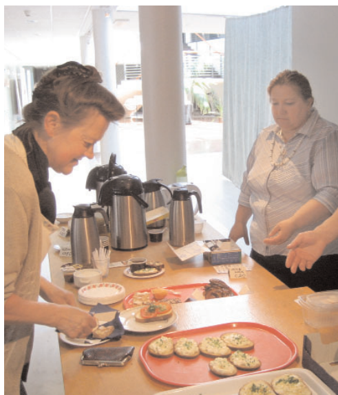
2011. aastal misjonikohvikus.