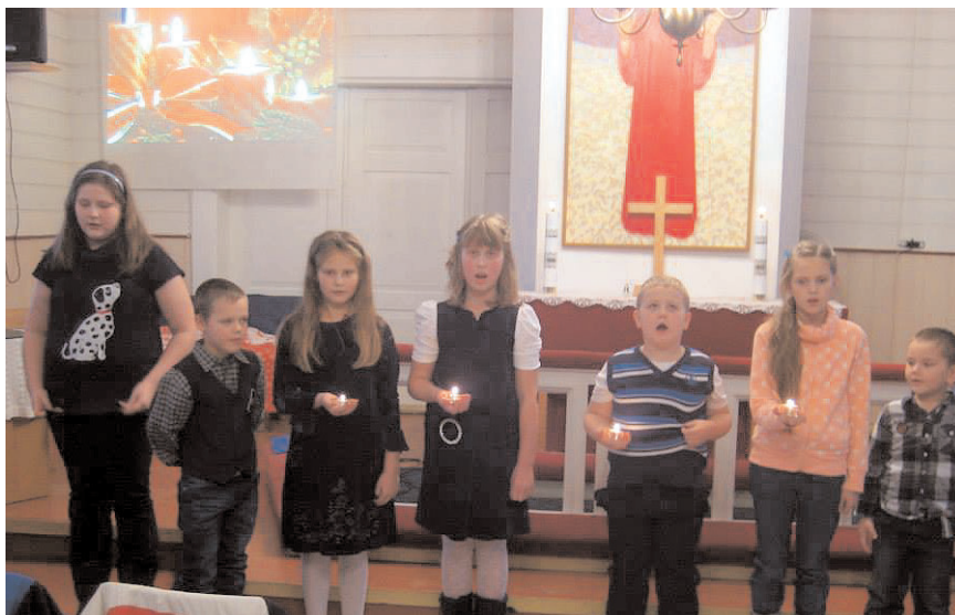
Reeküla pühapäevakoolilapsed õppisid jõuluks selgeks näidendi, mis rääkis küünaldest.