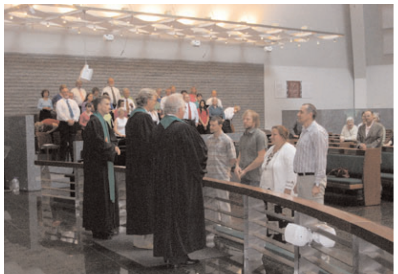
Soome-ugri misjonäride õnnistamine ja läkitamine 2008. aasta suvel Tallinna koguduses.