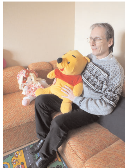
Kirikuvalitsus kiikas oma ringkäigul ka laste puhketuppa.

44 lapsest 34 on keskus käinud rohkem kui pooltel avatud päevadest. Keskmine külastatavus lapse kohta, arvestades tema teenusel olemise perioodi, on 68 protsenti. Suurtest peredest (vähemalt