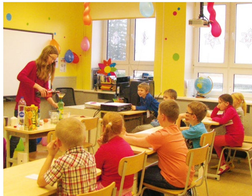
Фотография: основная школа в Сауга

Общая стоимость системы земляного отопления составила 62 000 евро и KIK поддержал эту инициативу из средств программы по охране окружающей среды в половинном объёме.