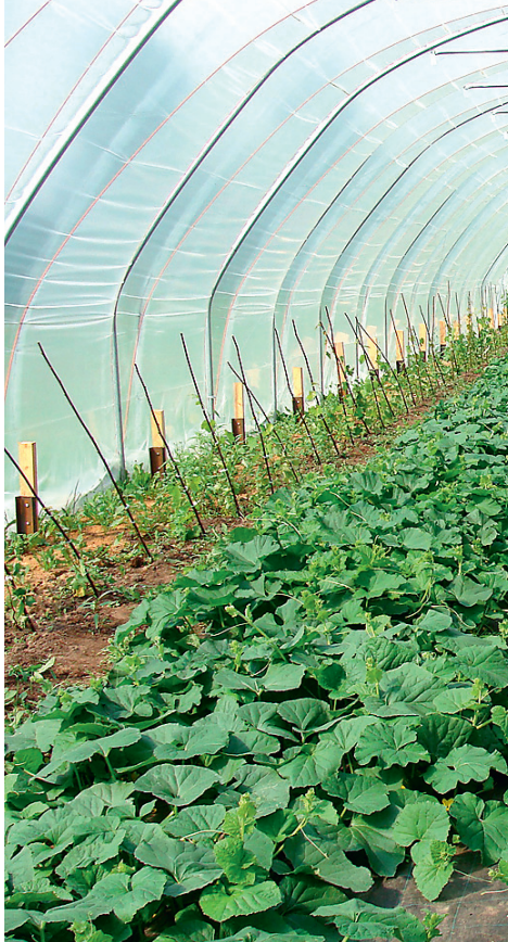
EKSOTILISEMAD taimed vajavad valmimiseks enamasti sooja valgusküllast kasvukeskkonda.