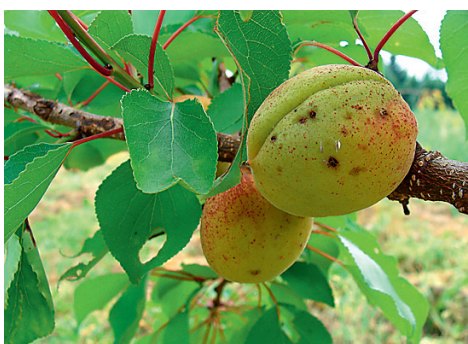
VIRSIK kasvab ka avamaal, ent käredeal talvel tasuks puud külma eest katta.