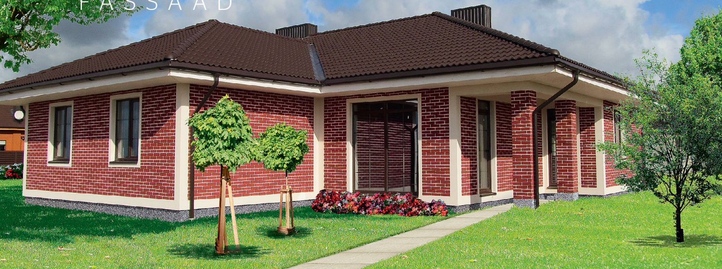
RUUMILINE fassaadikrohv mõjub seinale kantuna kui toekas kivimüür.