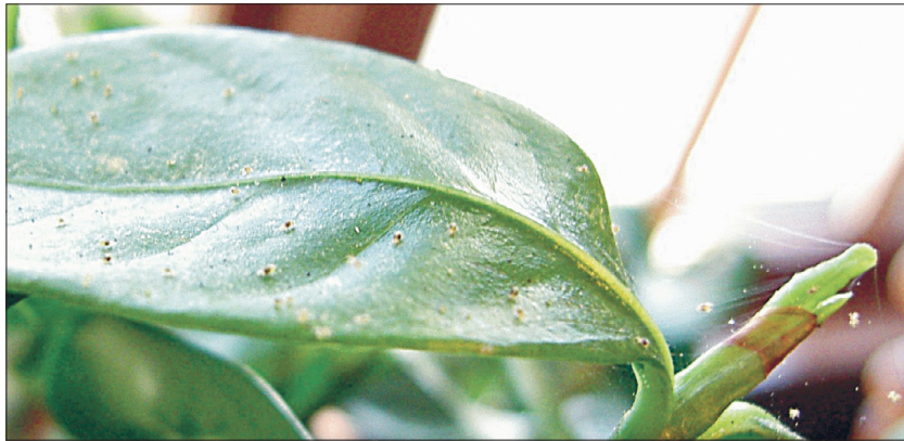
Kedriklest punub taimete peene võrgu.