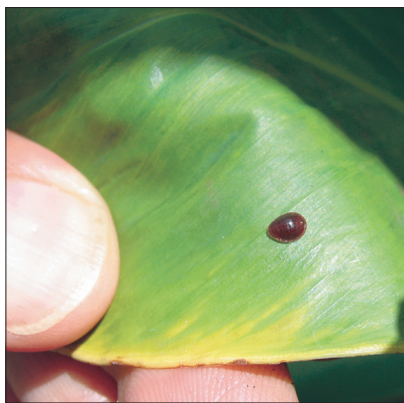
Kilptäi kõva kilp on lehepinnast veidi kõrgem.

■ Punane kedriklest rikub taimete välimust sinna (eelkõige lehe alumisele poolele) peent võrku punudes. Tema tuvastamiseks võtke luup, läbi mille näete tillukesi kaheksajalgseid pahalasi.