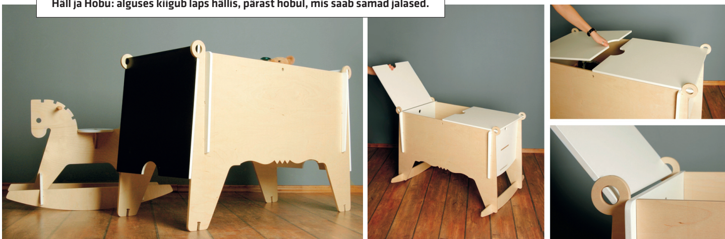
Häll ja Hobu: alguses kiigub laps hällis, pärast hobul, mis saab samad jalased.