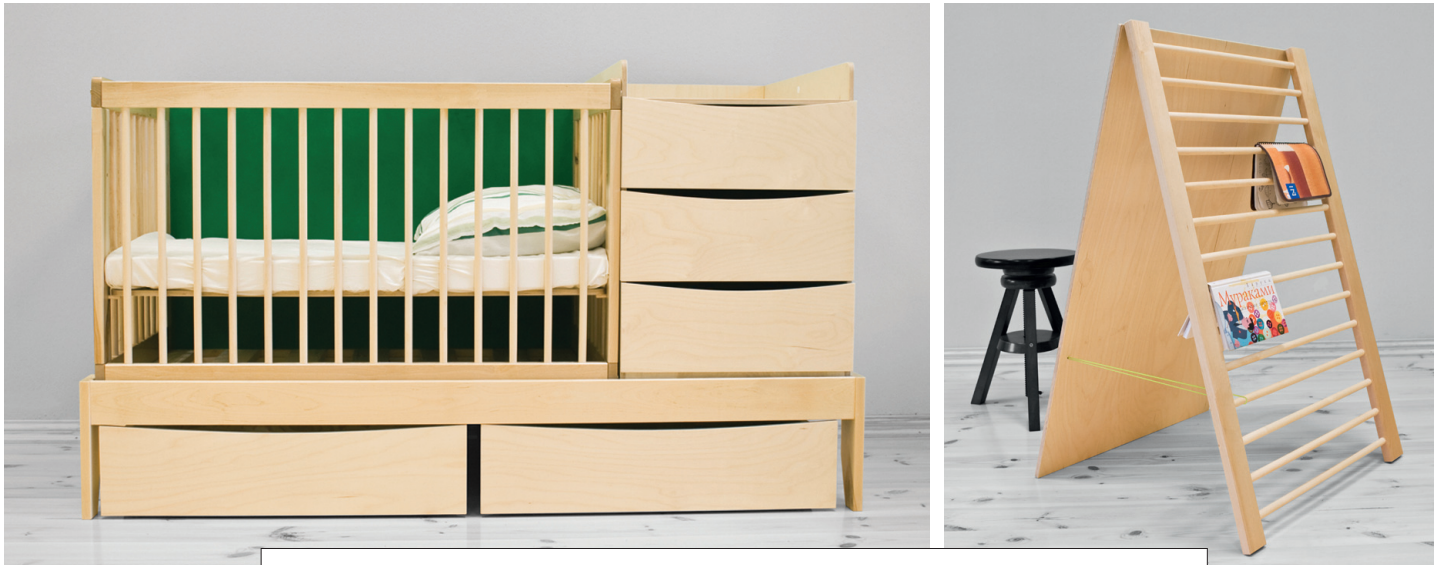
Kõik ühes ehk Smart Kid: kord (võre)voodi, kord mähkimislaud, kord tahvel, kord kirjutuslaud.