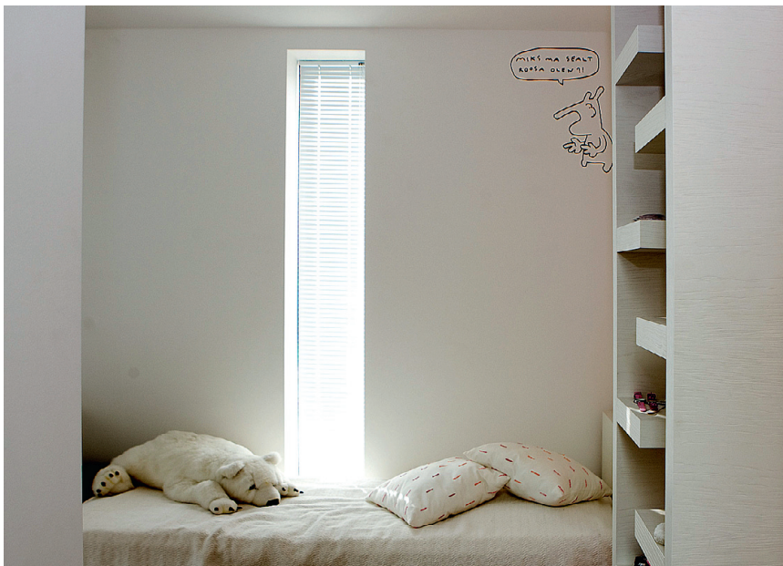
Lastetubades oleks justkui mõnda neist pesupulbritest, mis valge veelgi valgemaks lubab teha, katsetatud. Vaid üks koomiksitegelane on valgendamisest pääsenud.