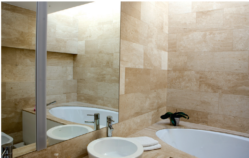
Vannitoa kreemikatele toonide lisab tubli annuse rahulolu ülalt katuseaknast langev keskpäevane valgus.