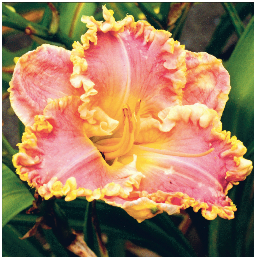
'Angelic Messenger' – väga tugevasti kurrutatud õieservadega sort.

Praegu on siiski veel ülekaalus diploidsed sordid. Kuna neid on hästi palju, leiab nende hulgast hõlpsalt sobiva värvi ja õiekujuga päevaliilia.