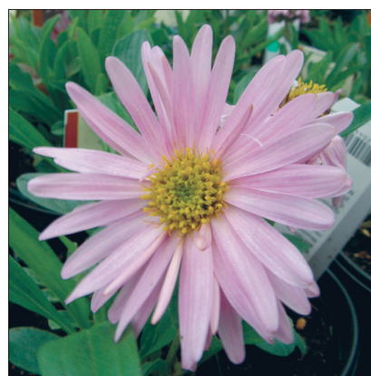
Alpi aster 'Happy End'.

Alpi aster ehk mägiaster ( A. alpinus ) näitab oma kollase südamikuga lillakassiniseid korvõisikuid juba juunis-juulis. Puhmiku kõrgus on 20–25 cm ja läbimõõt 45–50 cm. Aretatud on eri värvi keelõitega ja suuremate õisikutega sorte. Kaunite puhasroosade õitega on 'Happy End'.