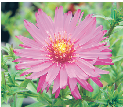
Madal aster 'Jenny'.