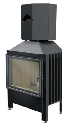
Spartherm Varia 1V+ Thermobox®