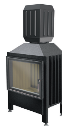
Spartherm Varia 1V + Aquabox®