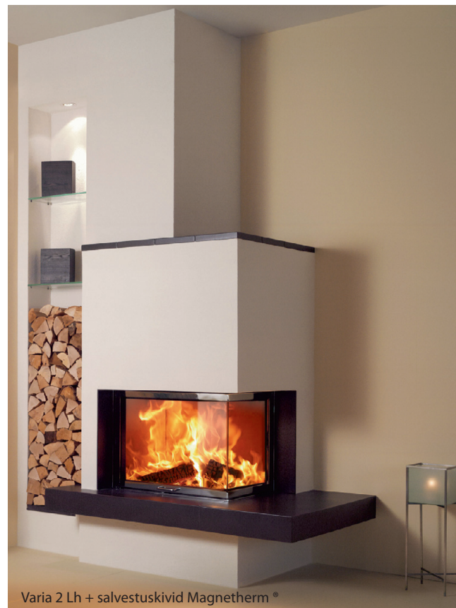
Varia 2 Lh + salvestuskivid Magnetherm®