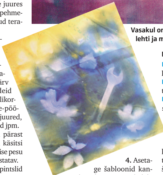
Vasakul on šabloonidena kasutatud taimede lehti ja mutrivõtit.