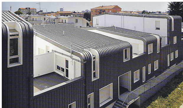
► Arhitekt: Boeri Studio. Valmis 2008.