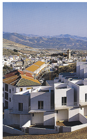
► Arhitekt: Antonio Jiménez Torrecillas. Valmis 2008.

Ühe pintsli tõmbena mõjub elujõuline ettevõtmine mõjub tänapäevasele, samas traditsioonilisele ning maalähedasele. See muudab need elamispinnad vastuvõetavaks ja ihaldusväärseks