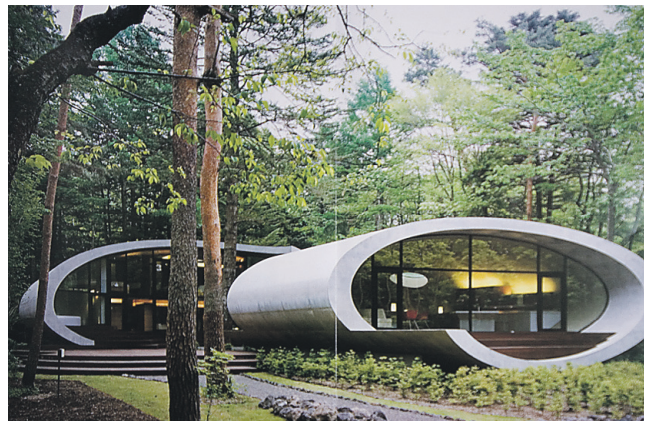
► Arhitekt: Artechic Architects. Valmis 2008.

ka interjööris, kus väljendub veelgi hoone läbiprojekteerituse ja detailse ühtsuse elegants. Analoogse lähenemine on olemas ka Eestis Indrek Undi oranžika ümarnurkadega betooneramu näol Pääsküla mändide all, kus detailitervik veelgi rabavam. Nii et ei jää põnev arhitektuurimõte meist kuhugi kaugemale, vaid levib ikka kõikjale.