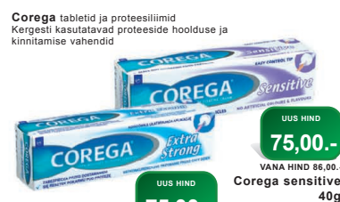
Corega tabletid ja proteesiliimid Kergesti kasutatavad proteeside hoolduse ja kinnitamise vahendid