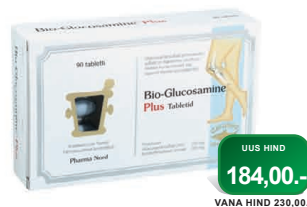
Bio-Glucosamine Plus tabletid 500mg N90 Tagab liigeste paindlikkuse