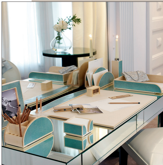
KIRJUTUSLAUA KOMPLEKT Inspireeritud art déco'st, valmistatud mägivahtrast ja šaagrännahast. Hind 19 200 kr. Komplekti osi saab ka eraldi osta.

1983-85 käis ta Parnham House Schoolis, kust väljuvad kuningriigi parimad tislendid.