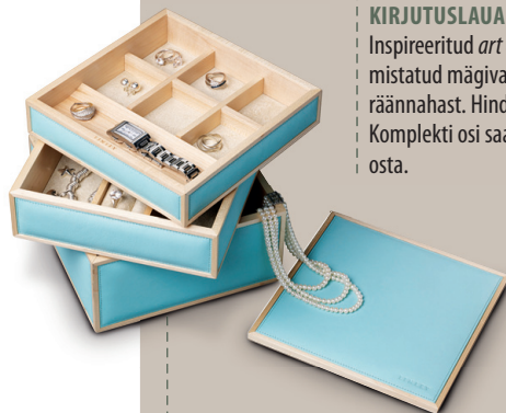
EHTEKARP Pähklipuust ja nahast kolmeosaline karp, valikus on ka lillat värvi mudel. Hind 6200 kr.