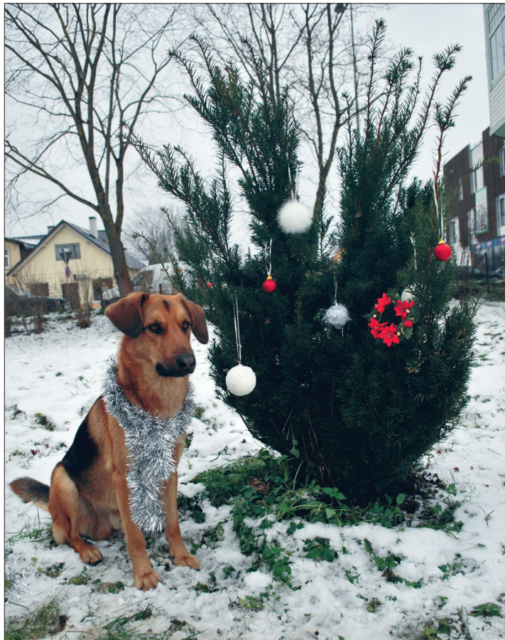
Kas jõuluvana juba tuleb?

Mida kinkida oma neljajalgsele sõbrale? Mida kaasa võtta, kui lähete jõuluõhtul külla peresse, kus on kass või koer?