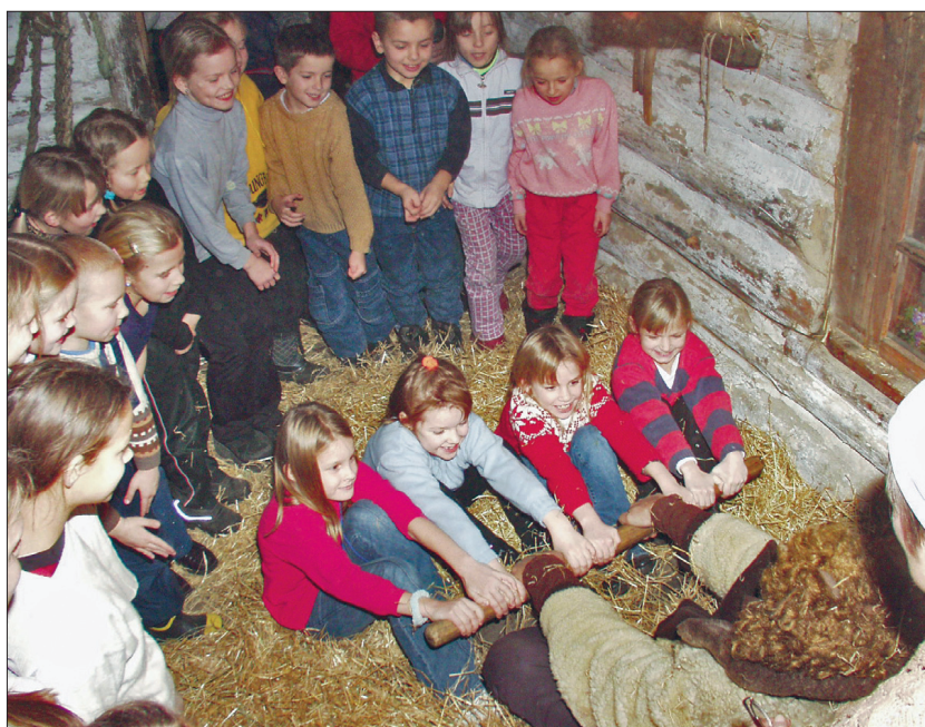
Põhus hullamine, jõu- ja osavusmängud olid ennemuiste jõuludel laste peamisi meelelahutusi.

Tüdrukutega pole perenaine nõus. Enam kui sajand tagasi olid need toidud maarahvale veel võõrad, tulles hulga hiljem mõisa või linnasugulaste kaudu. Jõulude puhul veristati ikka mõni loom, siis sai liha süüa isu pärast. Verest tehti vorsti või kääki. Lambamao sisse pandi tanguputru, seda kutsuti mauguks. Mõnel pool tehti ka valget tanguvorsti.