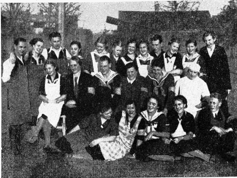
Pärnu aastakoosoleku köögitoimkond.

Linda kuhu juures nägin istumas ja nutmas ühte provintsi maleva skautjuhti. Küsisin, mis viga?