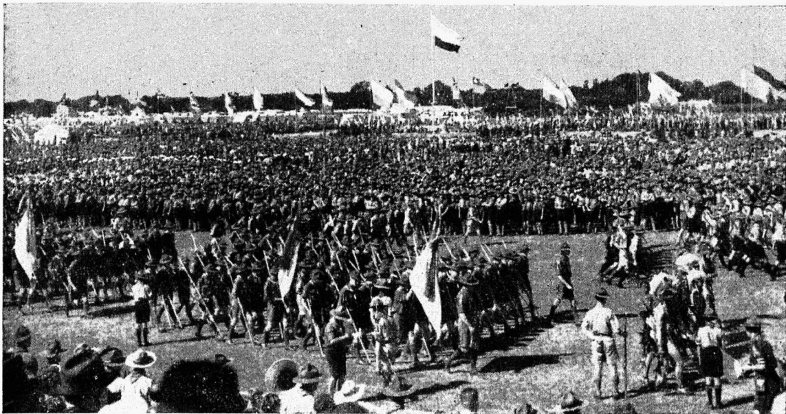
Üldvaade Hollandi Jamboreele.

tuna, selleks et minna ja õppida võõrastelt skauttarkust ja et hiljem tagasi tuldés seda edukalt rakendada isamaa ülesehitavas töös. Peagi katkeb laevaühendus sillaga ja laev kaob sadama muulide taha lahtisele merele. Kaua kostuvad kõrvu sadamasse mahajäänute hõisked ja laul.