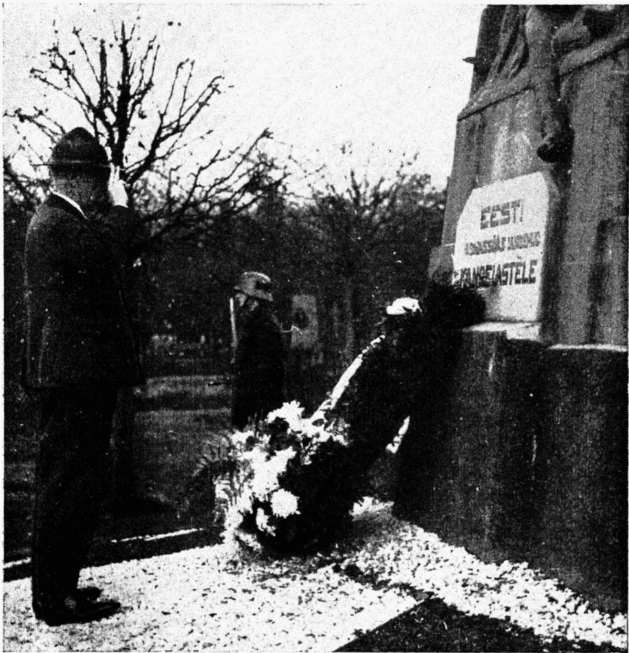
Peavanem skm. N. Kann asetab Pärnu Vabadussõjas langenute mälestussambale pärja 30.X.37.

Õige pea sellele järgneb omavaheline koosviibimine ning skautjuhid võivad endid lõbustada tantsuga, seekord tasuta.