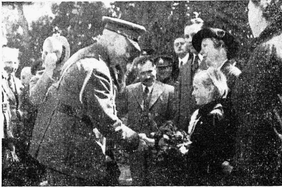
Tallinna väike gaid annetab sv. ülemjuhataja kindral Laidonerile Saaremaale vabadusristi vendade päevale tulekul kimbu lilli ja ütleb temale Saaremaal laagris olivate poolt sooje tervitussõnu 1937. a. suvel.

tahtnud püsida ning lipuvarda püstitamine tegi muret. Nüüd tagantjärele tekib see kõik vaid lõbusa tuju — kui meenub näiteks, kuidas gaiderte kogu esinase kerge matkatek kangekaelselt ei soovinud leppida talle määratud kohaga ning harrastas ööseti kokkulangemist; samuti teineteisega hingesuguluses olevad Tallinna ja Valga rüütelgid, sest kui üks neist langes oli teine ka kohe pikali; või jälle Tartu all-laagri pagemine merekaldalt metsa enam kindlamale pinnale.