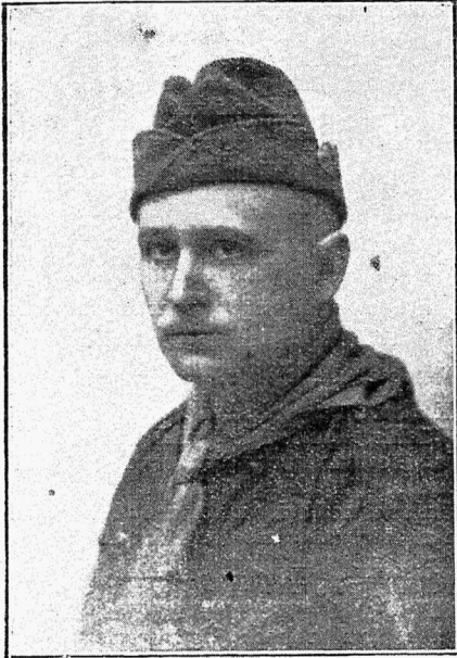
3. suurl. majandusvanem skm. A. Mitt.

oone kõigis suuremates linnades. Sektsioonid töötavad tihedas kontaktis kohalikkude skaudisõprade seltsidega.