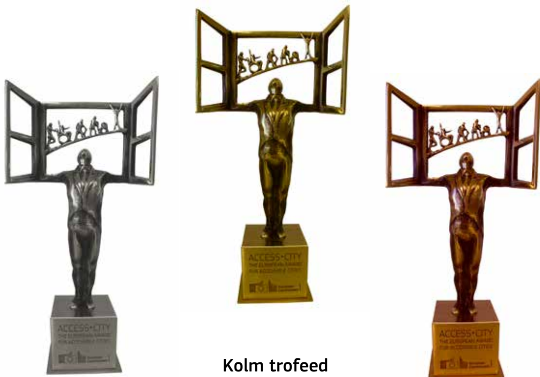
Kolm trofeed „Access-City ” auhind 2015