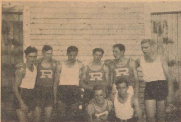
Unsere Mannschaft (im dunklen Hemd) wie zum Jugendsporifest in der 4×100 m Staffel siegte mit der Gegenmannschaft der Domschule.

Am 1. und 3. September d. J. fanden die alljährlichen Kämpfe um die Schulmeisterschaft in der