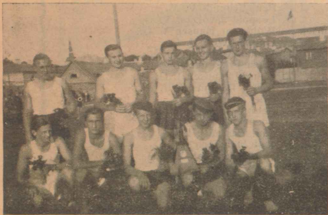
Unsere 10×100 m Mannschaft, die im Herbst zum zweiten Male den Wanderpreis erkämpft hat.

Leichtathletik statt. Bei diesen Kämpfen haben sich 37 Schüler aus den vier obersten Klassen beteiligt.