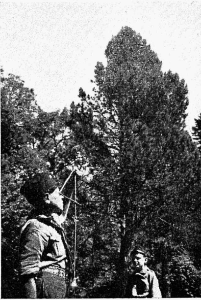
Eseme kõrguse mõõtmine.