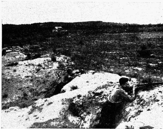
Noored kotkad laskmas.

2. Avatseremoonia on vist teie rühmadel juba kindlasti välja kujunenud ja